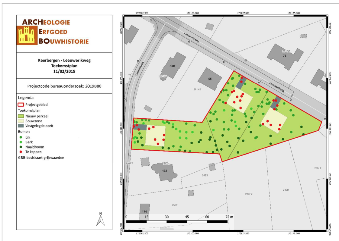
Figuur 3: Toekomstplan met aanduiding van de geplande werken (ARCHEBO bvba, 2019)