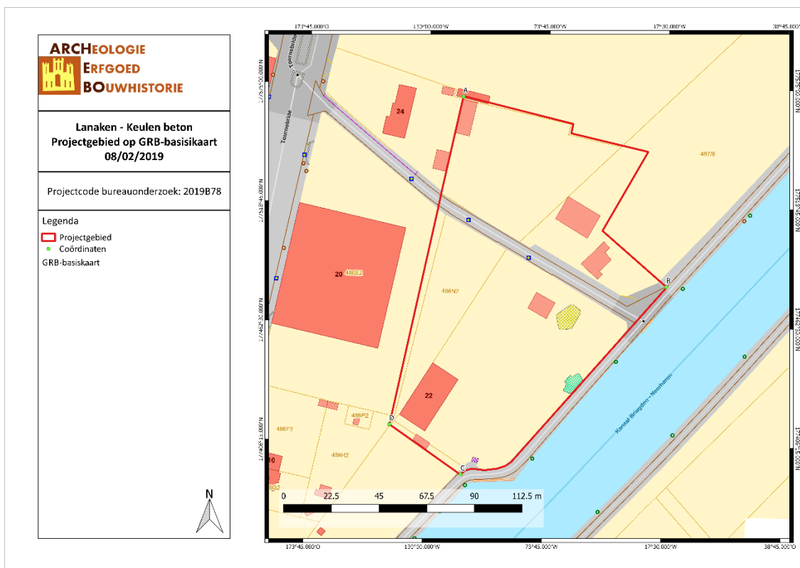
Figuur 1: Situering van het projectgebied op het GRB (Geopunt, 2019).