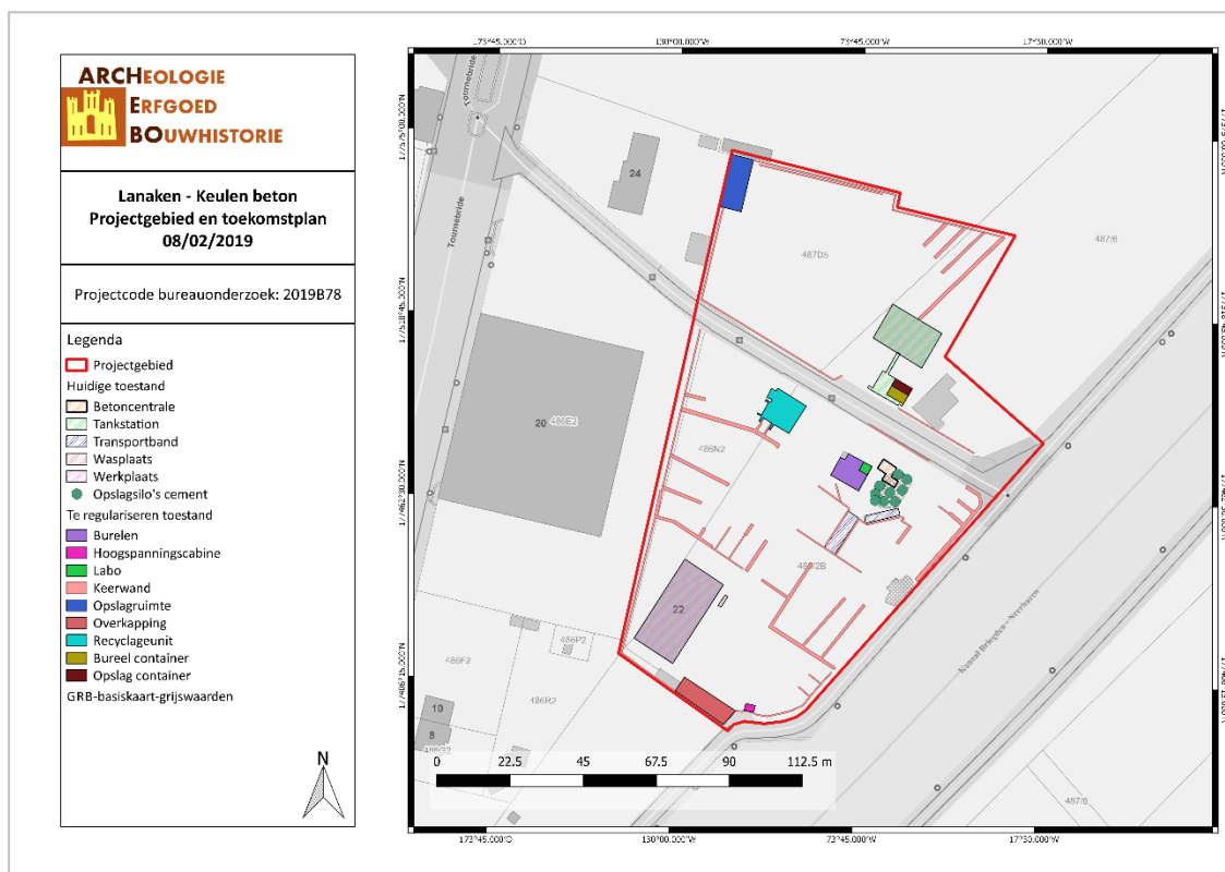
Figuur 3: Toekomstplan met aanduiding van de geplande werken in de eerste fase (Geopunt 2019)