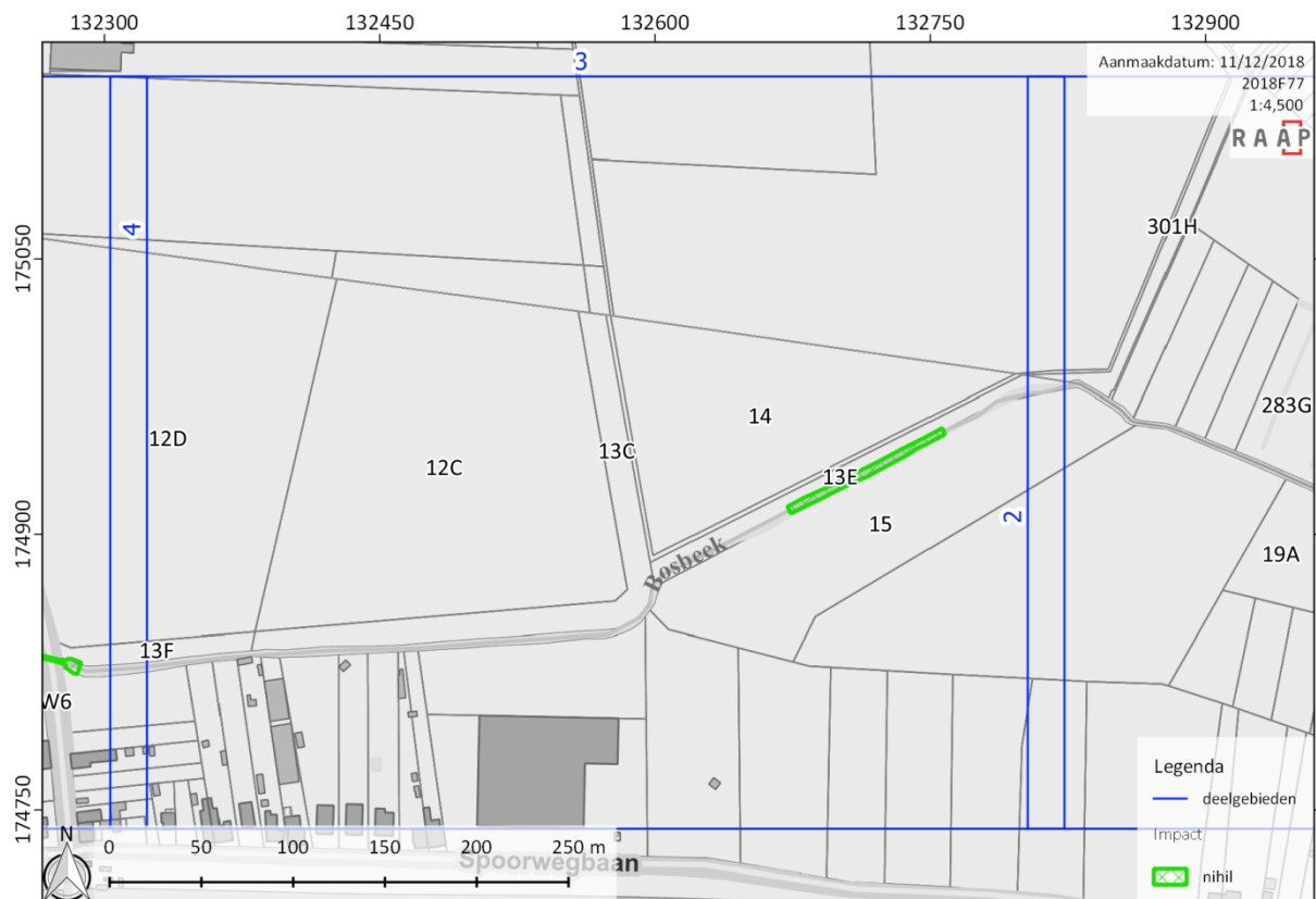
figuur 2 Projectie van de geplande bodemingrepen met aanduiding van hun impact binnen deelgebied 3 op de GRB-kaart (bron: AGIV, 2018).