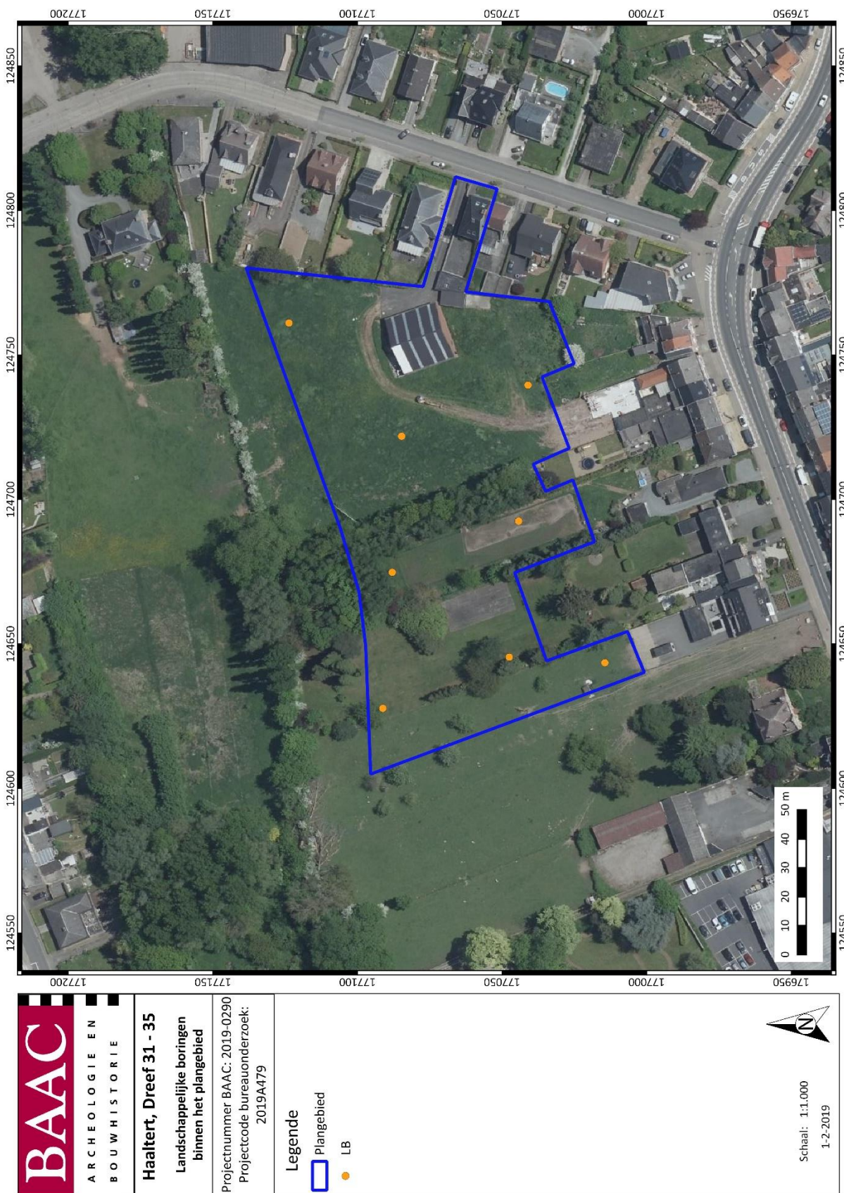
Plan 1: Inplanting van de landschappelijke boringen binnen het plangebied op een orthofoto (digitaal; 1:1000; 1-02-2019)