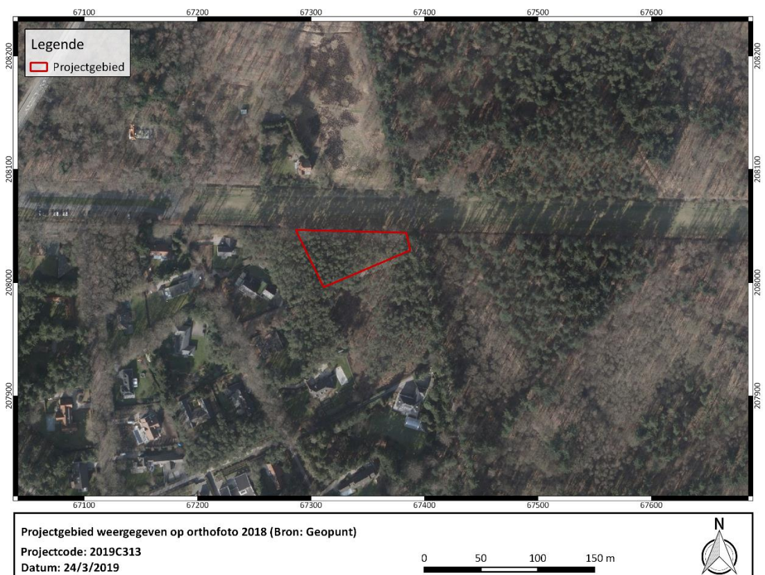
Figuur 2: Orthofoto 2018