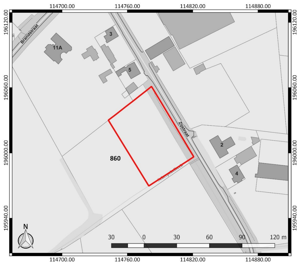
Figuur 1: Kadasterplan met aanduiding van het onderzoeksgebied in rood ( www.geopunt.be )