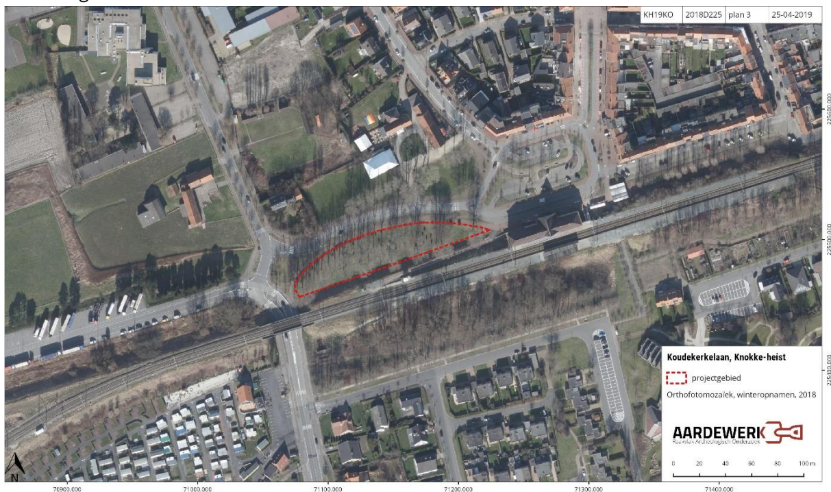
Figuur 1: Het ontwerpplan op de orthofoto 2018 (agiv)

De Gemeente Knokke-Heist plant de bouw van een evenementenhal met multifunctionele accommodatie langs de Koudekerkelaan in Heist. De oppervlakte van de geplande werken bedraagt 3.265 m 2 . De geplande bodemingreep is 1.620 m 2 groot. Om de mogelijke aantasting van het bodemarchief op deze terreinen in te schatten werkt Gemeente Knokke-Heist samen met Raakvlak. Doel van de opdracht is het waarderen van het terrein aan de hand van een bureauonderzoek en een landschappelijk bodemonderzoek. Dit onderzoek resulteert in een archeologienota.