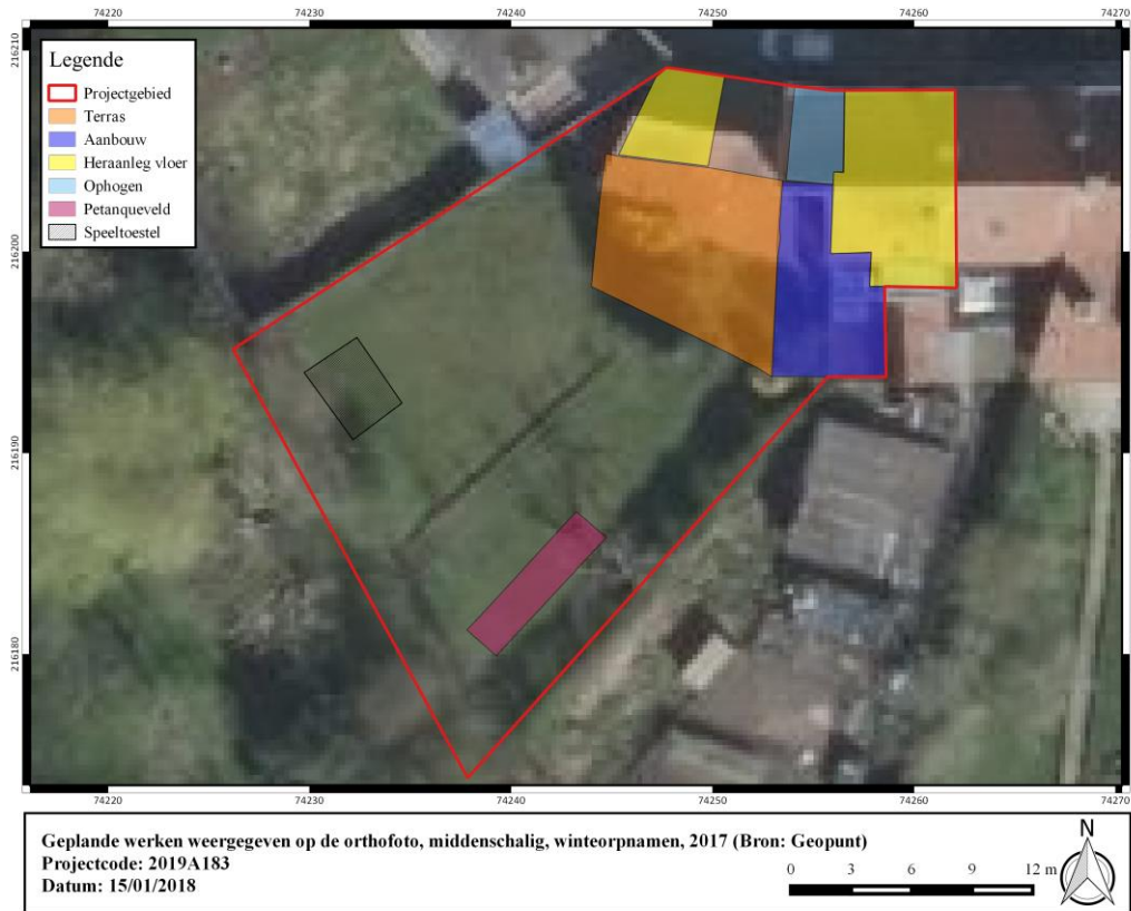
Figuur 2: Geplande werken weergegeven op de orthofoto