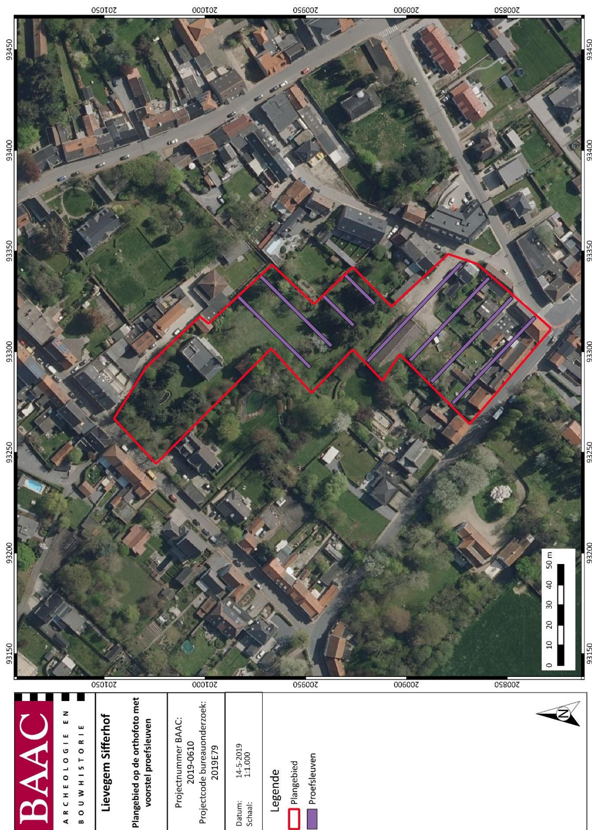
Figuur 3: Inplanting proefsleuven