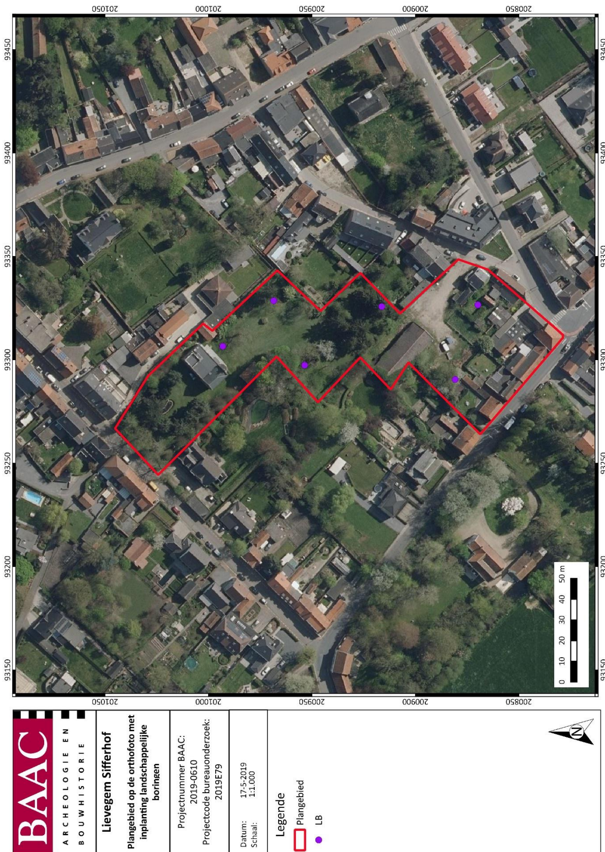
Figuur 2: Inplanting landschappelijke boringen