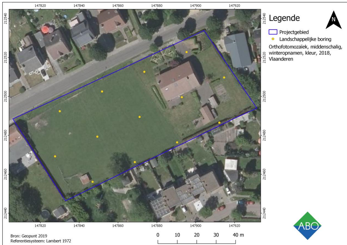
Figuur 2: Luchtfoto (middenschalige winteropnamen, kleur, 2018) met aanduiding van de boorpunten voor het landschappelijk bodemonderzoek.