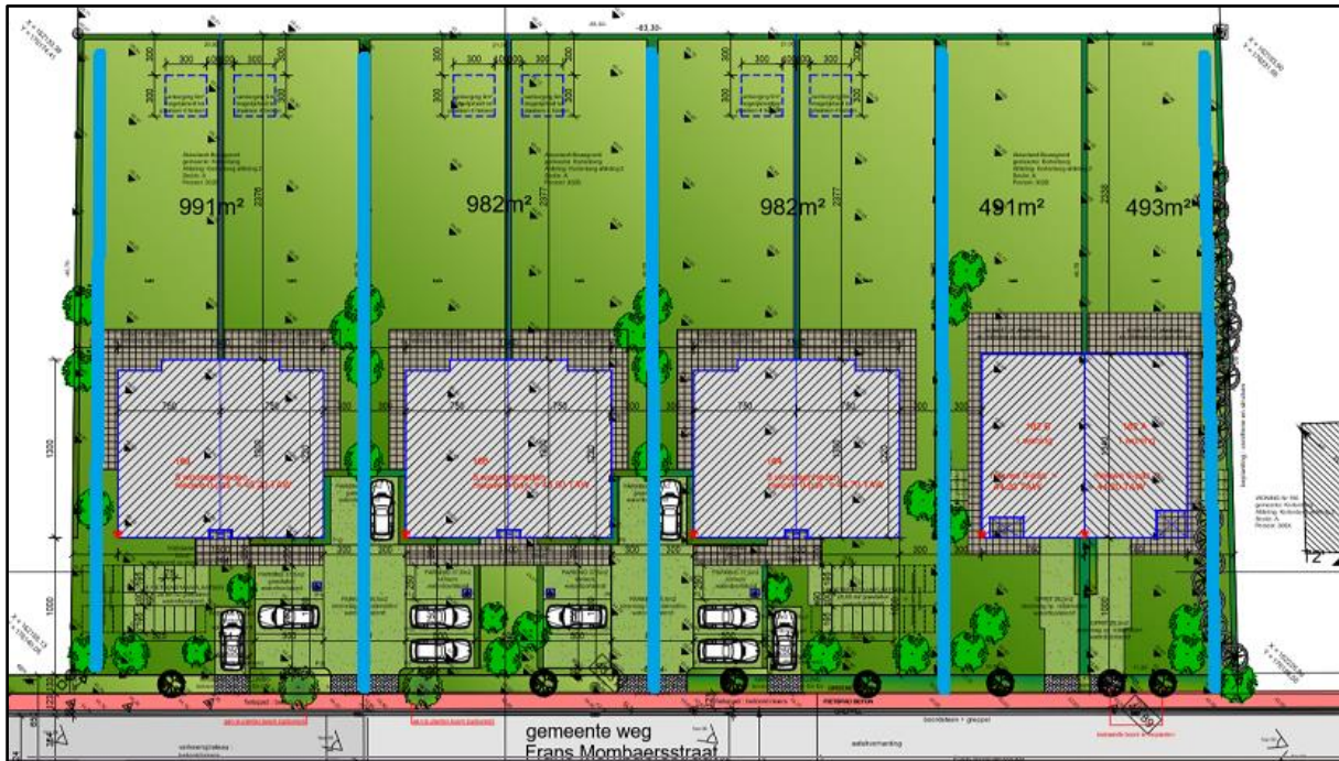
Figuur 2 Indicatief sleuvenplan, geprojecteerd op de geplande werken (bron: geopunt.be).