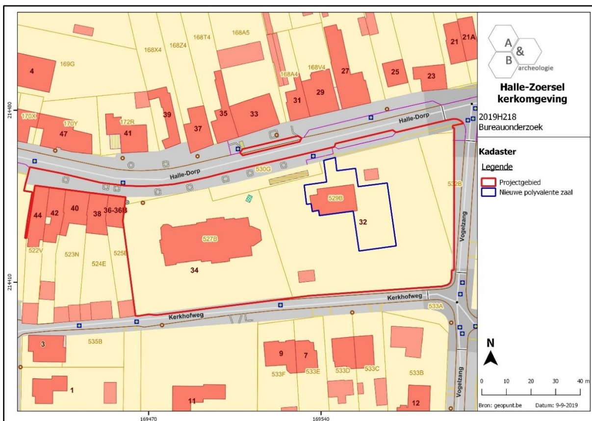
Figuur 1 Plangebied aangeduid op het kadasterplan.

Verspreid over het plangebied worden proefputten en -sleuven aangelegd.