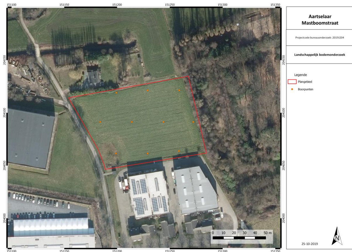
Figuur 2: Voorstel boorgrid.

Op basis van het bureauonderzoek lijkt het projectgebied weinig verstoringen te kennen. Een landschappelijk bodemonderzoek kan hier meer uitsluitsel over geven, net als over de gaafheid van het bodemprofiel. Dit kan ons meer vertellen over de eventuele aanwezigheid van steentijdsites. In de buurt werden reeds lithische artefacten gevonden, maar er werd nog geen systematisch archeologisch onderzoek uitgevoerd. Er werden ook sporensites uit de ijzertijd/Romeinse periode aangetroffen. Het is dan ook aangewezen een landschappelijk bodemonderzoek uit te voeren door middel van boringen om zo een gedegen inzicht te krijgen in de bodemopbouw. Het booronderzoek