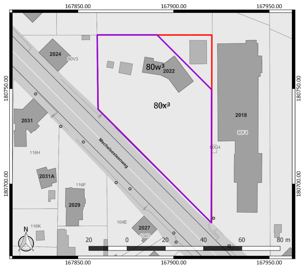
Figuur 1: Kadasterplan met aanduiding van het onderzoeksgebied in rood en de te onderzoeken zone (paars) ( www.geopunt.be )

Kadastrale percelen: Herent, Afdeling 5, sectie C, nummers 80w 3 en 80x 3