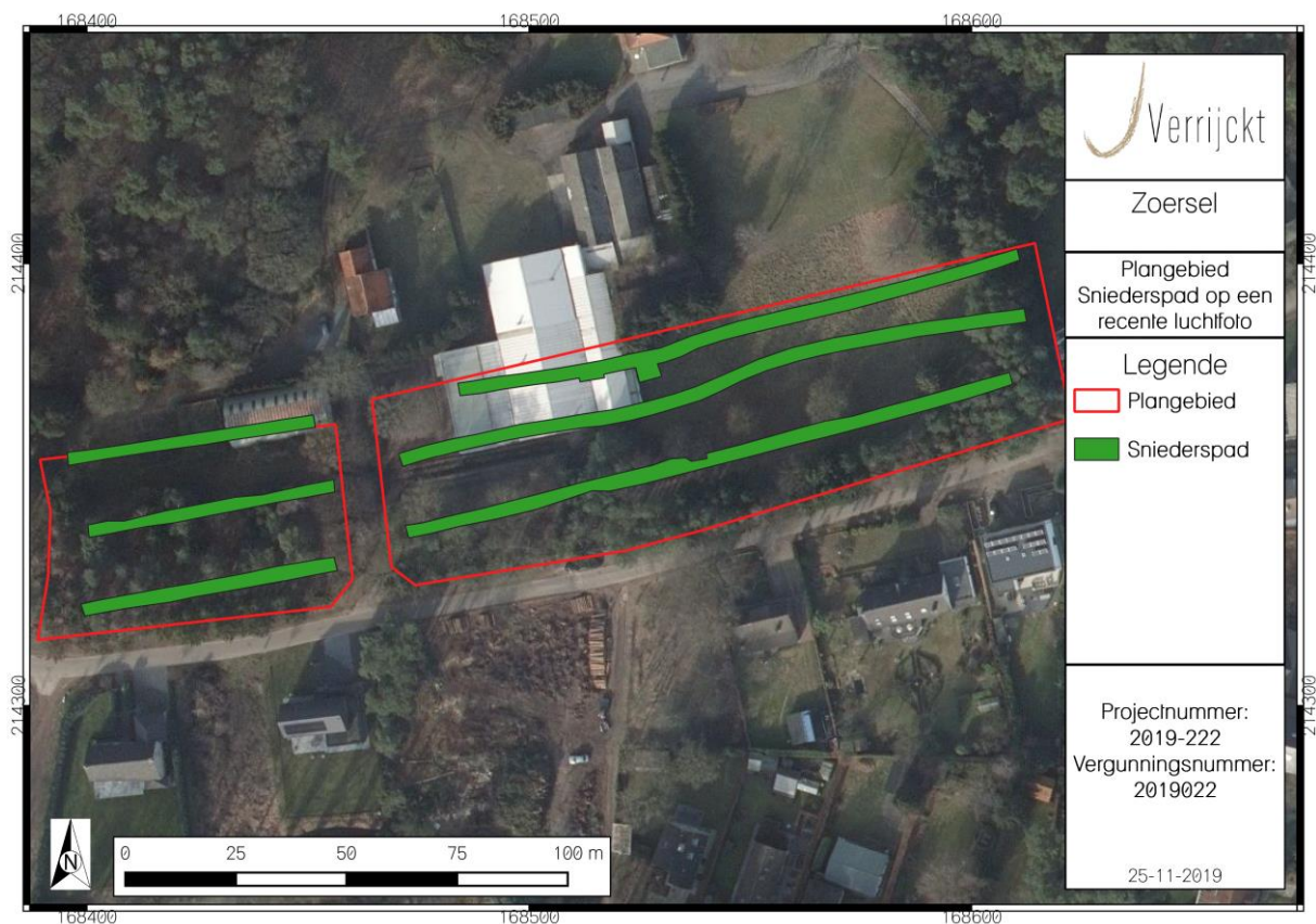
Figuur 1: locatie van het gebouw ten opzichte van de proefsleuven. Het gesloopte gebouw is in wit omkaderd.

Op 20 augustus en 5 september 2019 werd het voormalige bedrijfsgebouw tussen de Watermolen en het Sniederspad gesloopt (fig. 1). Aanwezig bij de sloop van het gebouw was Jeroen Verrijckt. Binnen de contouren van het plangebied is het gebouw gesloopt zonder verdere uitgraving van de bodem.