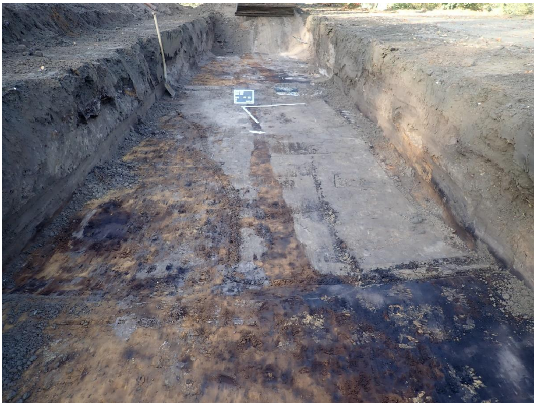
Figuur 3: Verstoring ter hoogte van het afgebroken gebouw, in het westen van werkput 6 langsheen het Sniederspad.