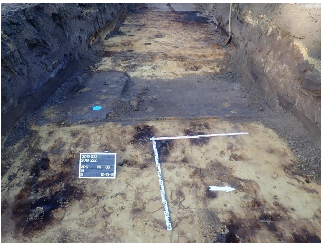
Figuur 4: Greppel S6007 ter hoogte van het afgebroken bedrijfsgebouw.