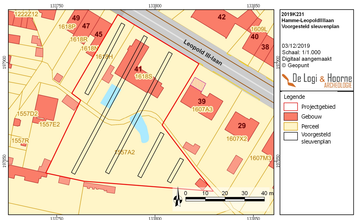
Figuur 27: Voorgesteld proefsleuvenplan (© Geopunt)

Het gehanteerde verspringend, regelmatig driehoeksgrid zal nu een kleinere resolutie hebben, met 5m afstand tussen de raaien, en 6m tussenafstand bij de boringen in een raai. De boorpunten worden uitgezet en ingemeten met GPS, zodanig dat de x-, y- en z-coördinaten van elke boring gekend zijn. Het booronderzoek wordt met handmatige boringen uitgevoerd. De diepte van de boringen is nader te bepalen aan de hand van de resultaten. De sedimenten zullen worden opgeboord met een Edelmanboor met een boorkop van minimaal 10cm diameter. Van elke boring wordt de volledige diepte per boring, en onder- en bovengrens van de horizonten geregistreerd. De opgeboorde sedimenten zullen steeds de relevante lagen omvatten, die nodig