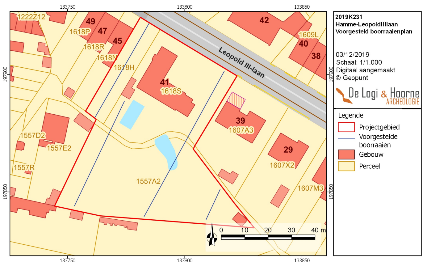
Figuur 26: Voorgesteld landschappelijk onderzoek

Deze methode garandeert dat er op een efficiënte manier gewerkt kan worden. Door de combinatie van de geselecteerde transecten en de bodemkaart kan bepaald worden in hoeverre verder booronderzoek zin heeft of niet. De werkwijze toetst de bodemkaart en zal uiteindelijk bepaalde zones moeten uitsluiten en selecteren voor verder landschappelijk bodemonderzoek. De geselecteerde zones worden eventueel verder onderzocht met een verkennend en waarderend archeologisch booronderzoek. Indien er voldoende boringen gezet zijn om de onderzoeksvragen te beantwoorden, dan kan ervoor geopteerd worden om bepaalde raaien niet, of slechts deels uit te voeren. Indien tijdens het terreinwerk blijkt dat het gewenst is om een raai te verplaatsen, om zo meer informatie te verzamelen of door de aanwezigheid van nutsleidingen dan kan een raai worden aangepast. Wanneer voldoende boringen gezet zijn