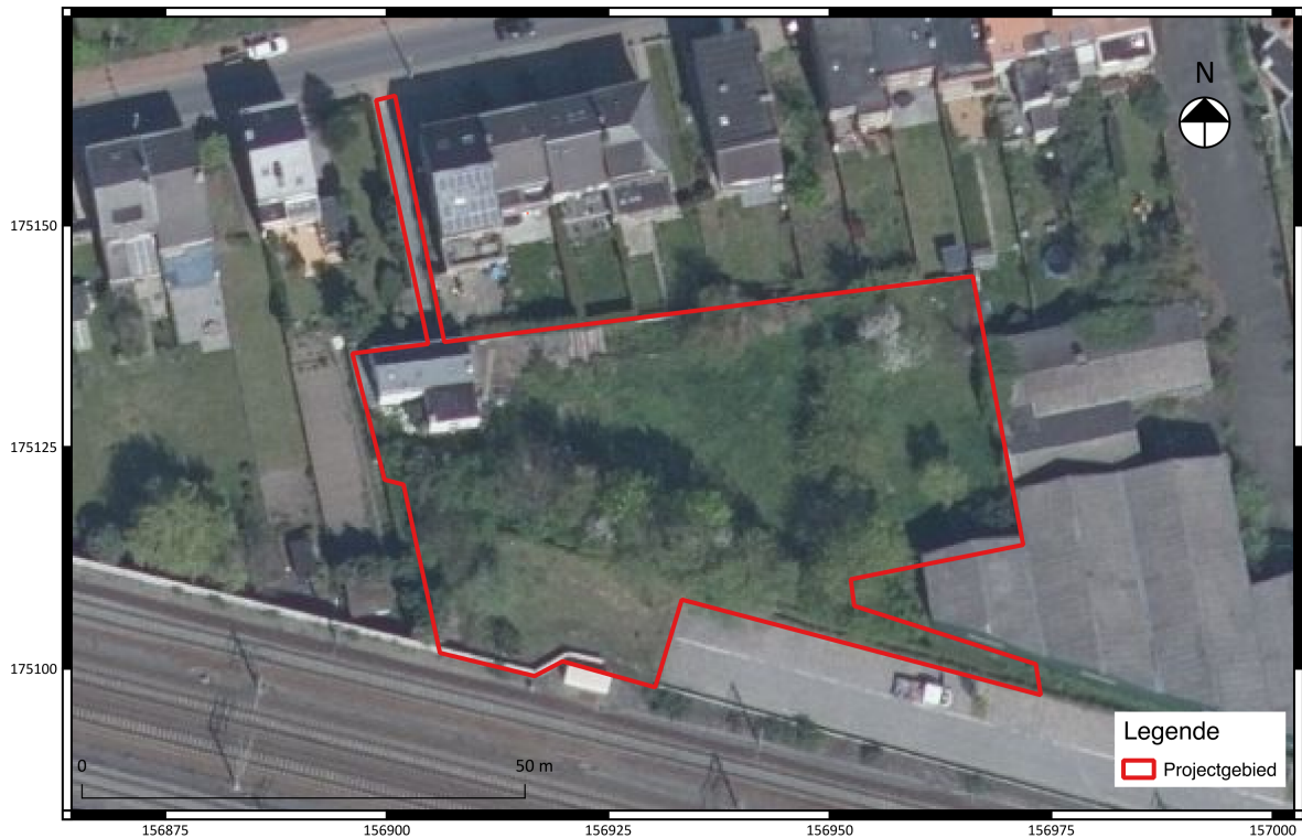
Fig. 2.2: Detail uit een luchtfoto van 2019 met aanduiding van het projectgebied.