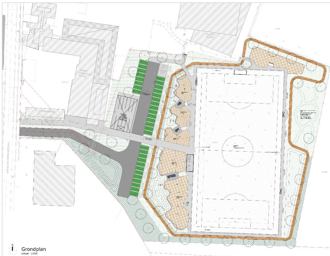
Figuur 1: Opmetingsplan (bron: VK Architects & Engineers).

Bij deze bodemingrepen kan worden uitgegaan van een globale verstoring van 0.5 m diepte binnen het ganse projectgebied.