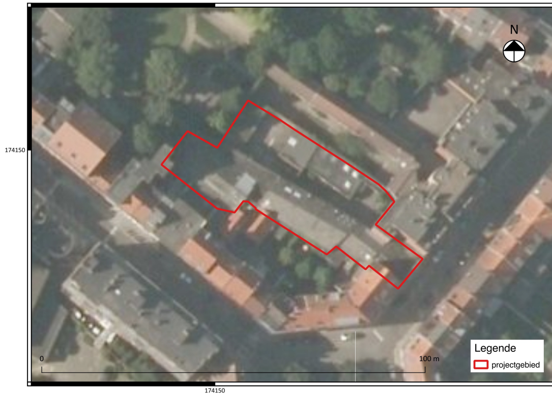
Fig. 3.2: Recente luchtfoto met daarop de huidige terreincondities aangeduid.