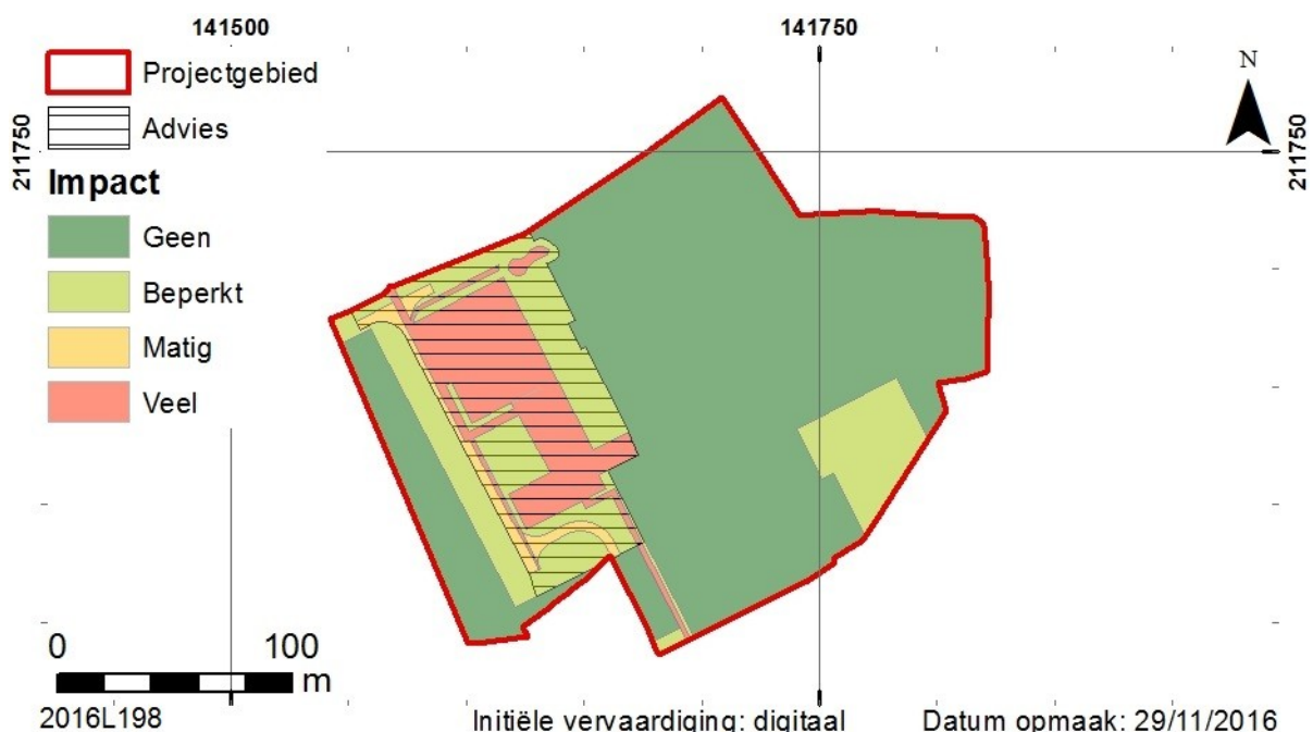
Fig. 1. Overzicht van de impactbepaling en de zone waar verder onderzoek geadviseerd wordt.

Rekening houdende met deze factoren wordt geadviseerd om de noordelijke zone met een oppervlakte van ± 9118 m 2 verder te onderzoeken. Hierbij dient echter wel rekening te worden gehouden met de bestaande bebouwing. Bij verder onderzoek dient hier voldoende ruimte vrijgehouden te worden teneinde de stabiliteit van het gebouw niet in het gedrang te brengen.