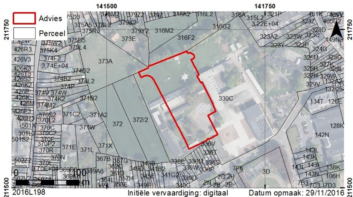
Fig. 2. Situering van de geadviseerde zone voor vervolgonderzoek op het kadaster (GDI-Vlaanderen 2015).

Indien de beoogde bouwwerken niet door kunnen gaan en het archeologisch erfgoed niet bedreigd wordt, dient de prospectie met ingreep in de bodem niet uitgevoerd te worden.