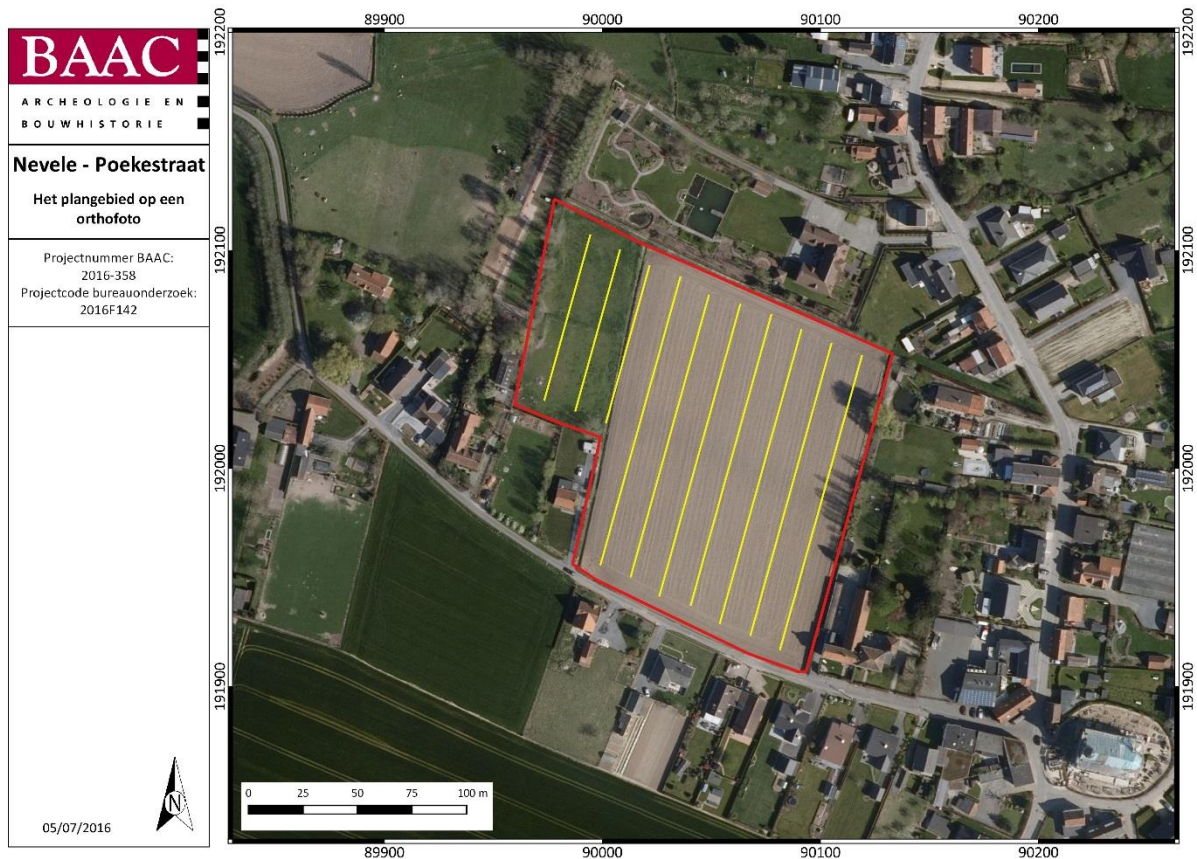
Figuur 1: inplanting proefsleuven (geel) op plangebied Nevele Poekestraat (plot BAAC op orthofoto Geopunt)

Gezien de vondsten van steentijd materiaal in de ruimere omgeving van het plangebied moeten bij het aanleggen van de proefsleuven met name de bovenste niveaus van het bodemprofiel voorzichtig en laagsgewijs worden verdiept. Hierbij dient minstens een archeoloog met ruime ervaring in het opsporen en opgraven van steentijdresten te worden ingezet.