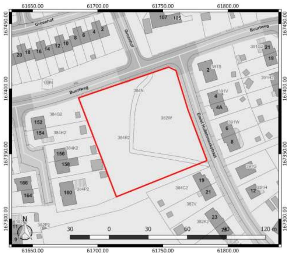
Figuur 1: Kadasterplan met aanduiding van het onderzoeksgebied in rood ( www.geopunt.be )