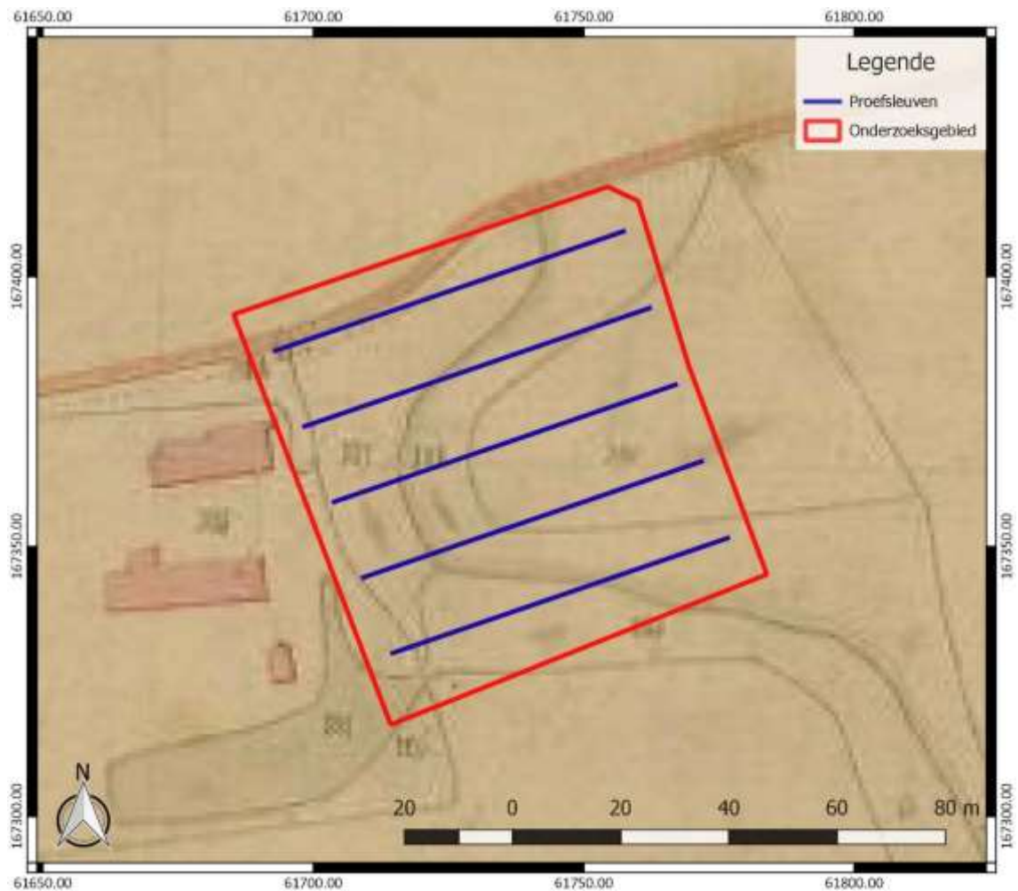
Figuur 6: Inplanting van de proefsleuven (blauw), binnen het onderzoeksgebied (rood), weergegeven op het Primitief Kadaster ( www.cartesius.be )