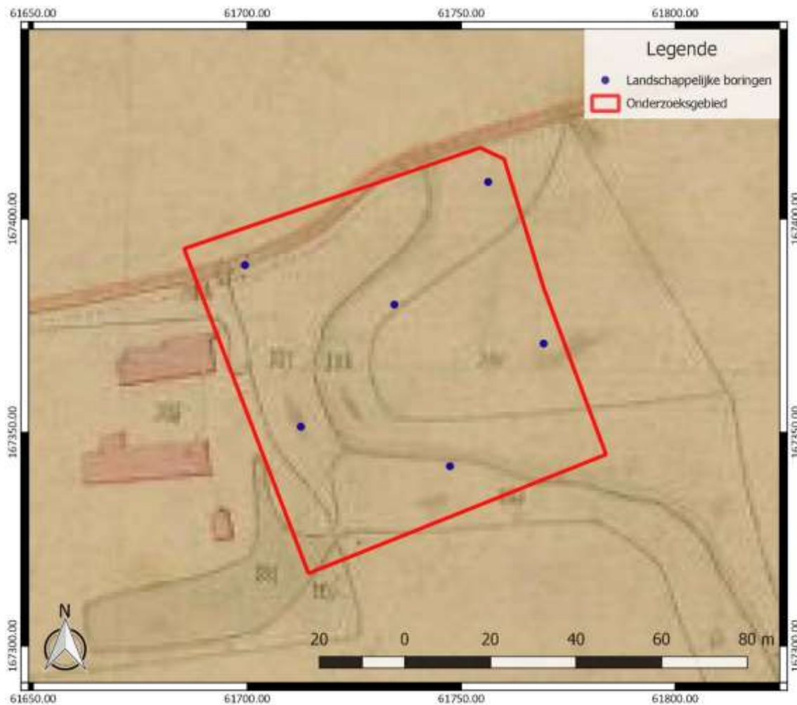
Figuur 4: Inplanting van de landschappelijke boringen (blauw), binnen het onderzoeksgebied (rood), weergegeven op het Primitief Kadaster ( www.cartesius.be )