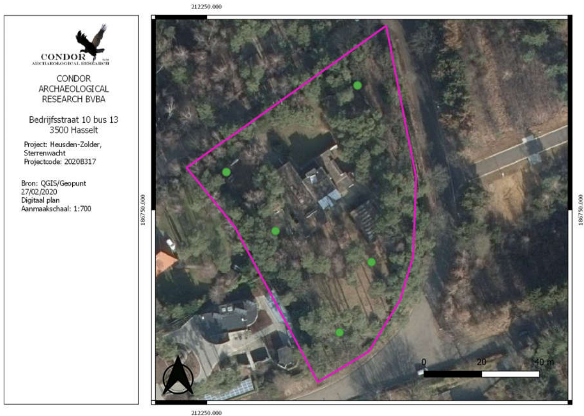
Afbeelding 1: Locaties van de landschappelijk boringen (groene bollen) weergegeven op de luchtfoto.