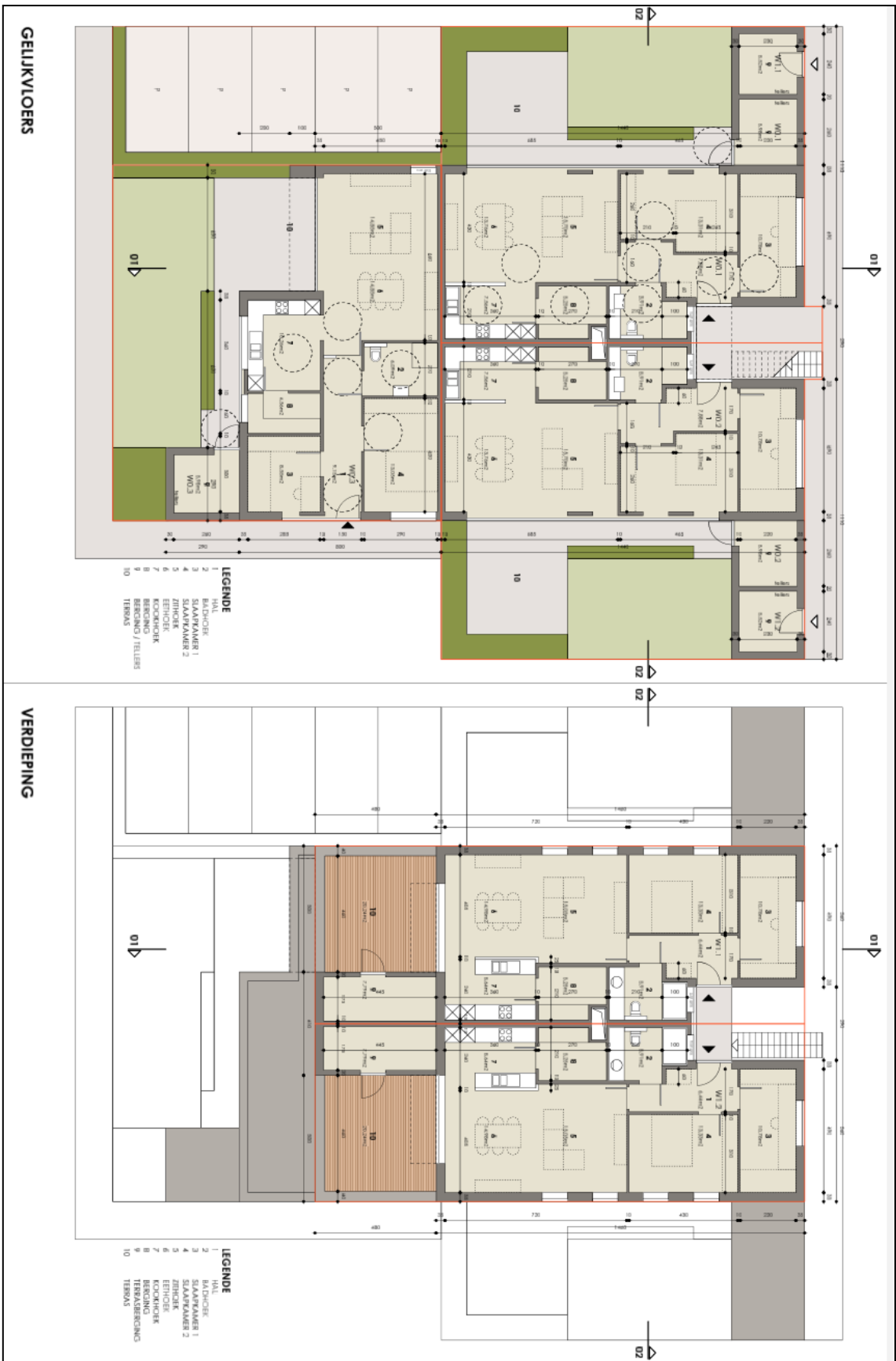
Figuur 3.2: Overzichtplan nieuwbouw