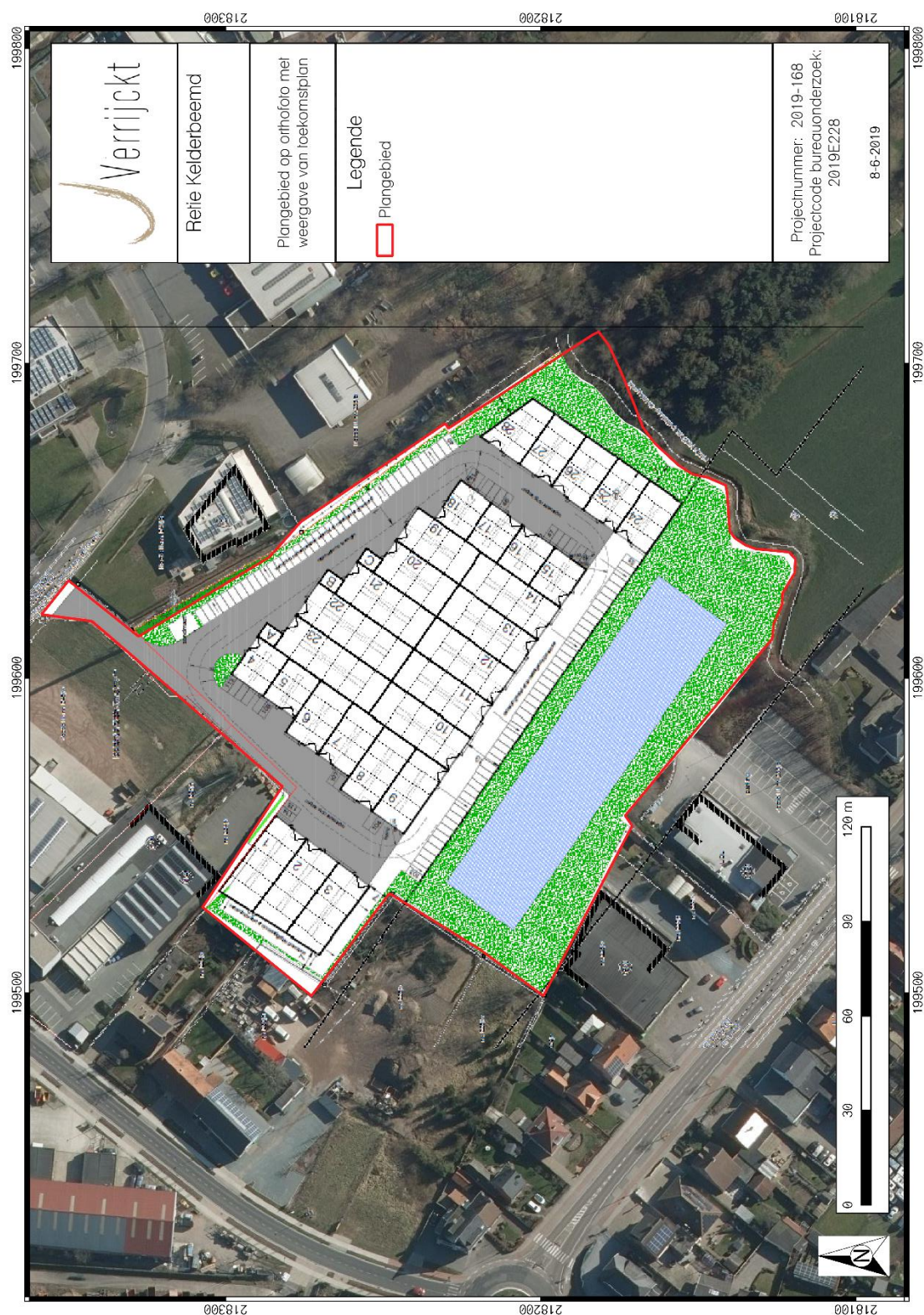
Figuur 1: Plangebied met weergave van toekomstige inplanting 1 op orthofoto 2