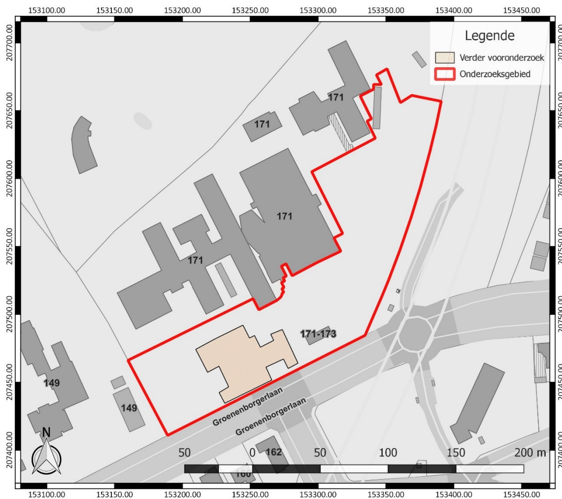
Figuur 2: Zone afgebakend voor verder vooronderzoek, weergegeven op het GRB ( www.geopunt.be )