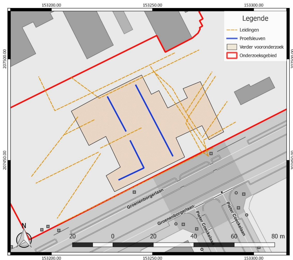
Figuur 3: Inplanting van de proefsleuven (blauw), binnen het onderzoeksgebied (rood), weergegeven op het GRB ( www.geopunt.be )

De proefsleuven hebben een maximale tussenafstand van middelpunt tot middelpunt van 15 m. De beoogde oppervlakte die onderzocht dient te worden door middel van proefsleuven, bedraagt minimaal 10 %. Dit wordt behaald aan de hand van het vooropgestelde sleuvenplan, dat voorziet in 87 lopende m proefsleuven, indien de proefsleuven een breedte van 2,5 m hebben .