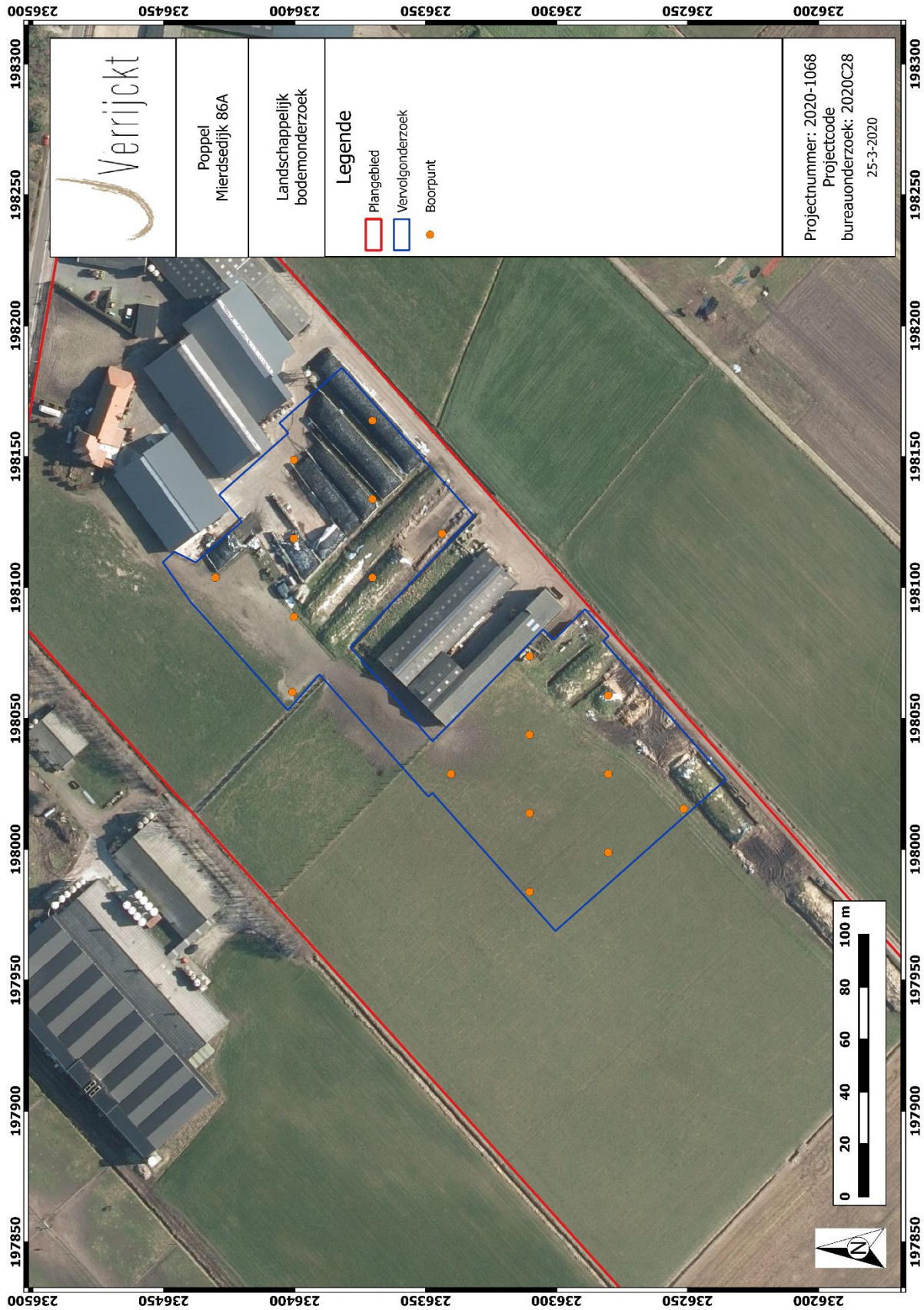
Figuur 4: Inplanting landschappelijke boringen