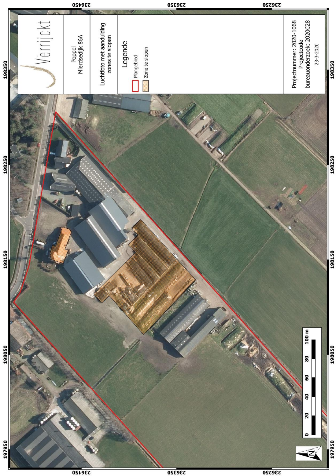
Figuur 2: Plangebied met weergave van de sloopwerken 2 op orthofoto 3