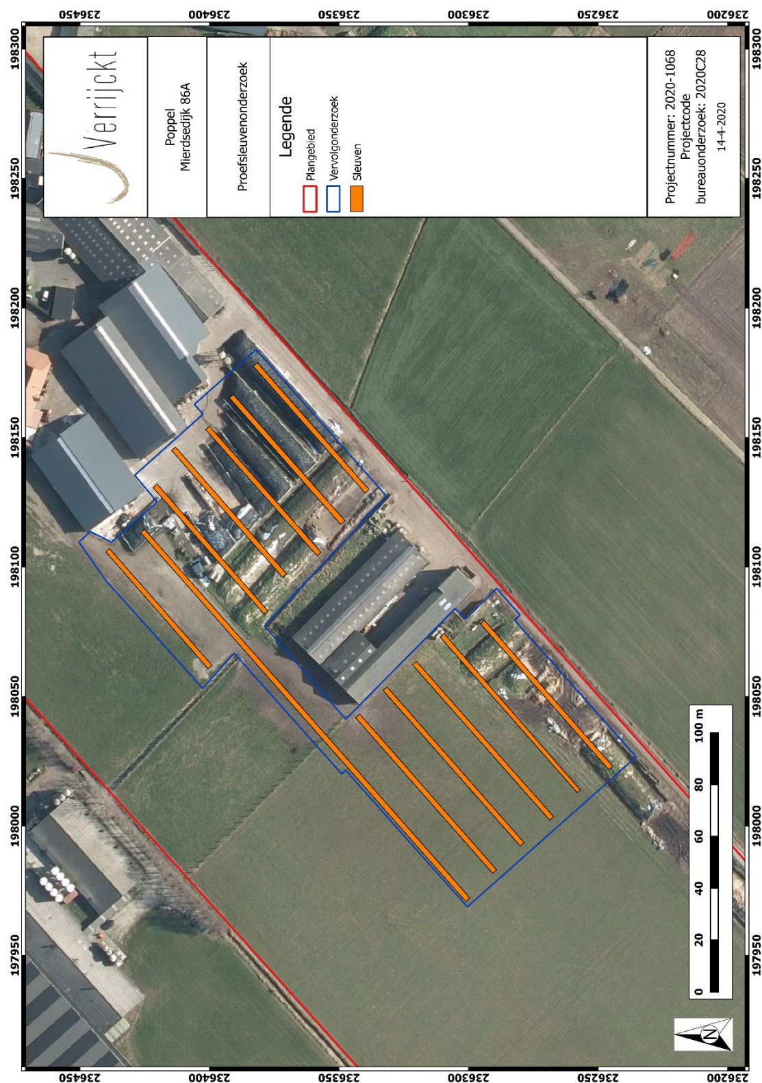
Figuur 5: Sleuvenplan