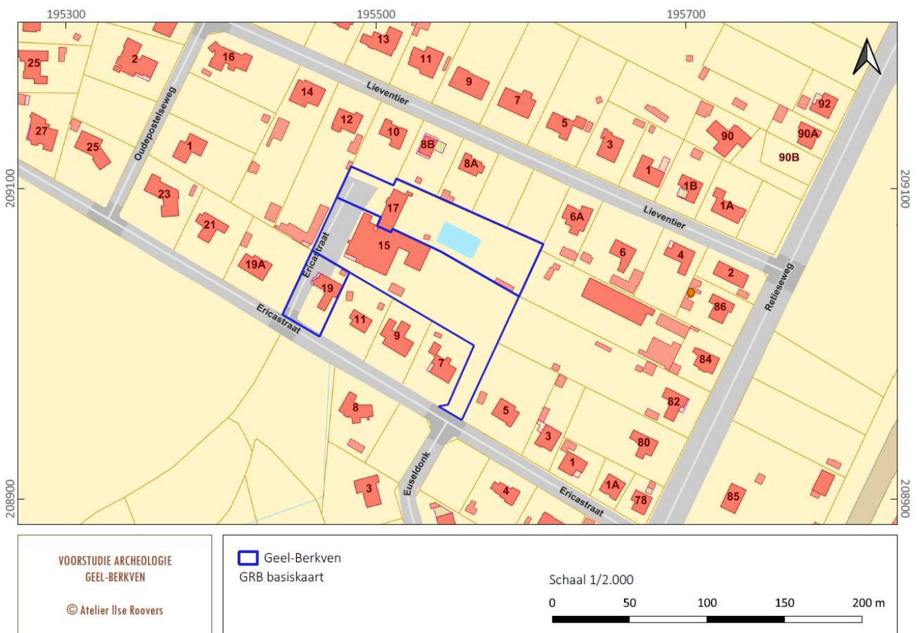
Figuur 1: Het plangebied Geel-Berkven op het Grootchalig Referentie Bestand, aangemaakt op schaal 1/10.000

Het betreft een aanvraag voor de afbraak van een bestaande woning en het verbouwen en uitbreiden van bestaande serviceflats naar een revalidatievoorziening.