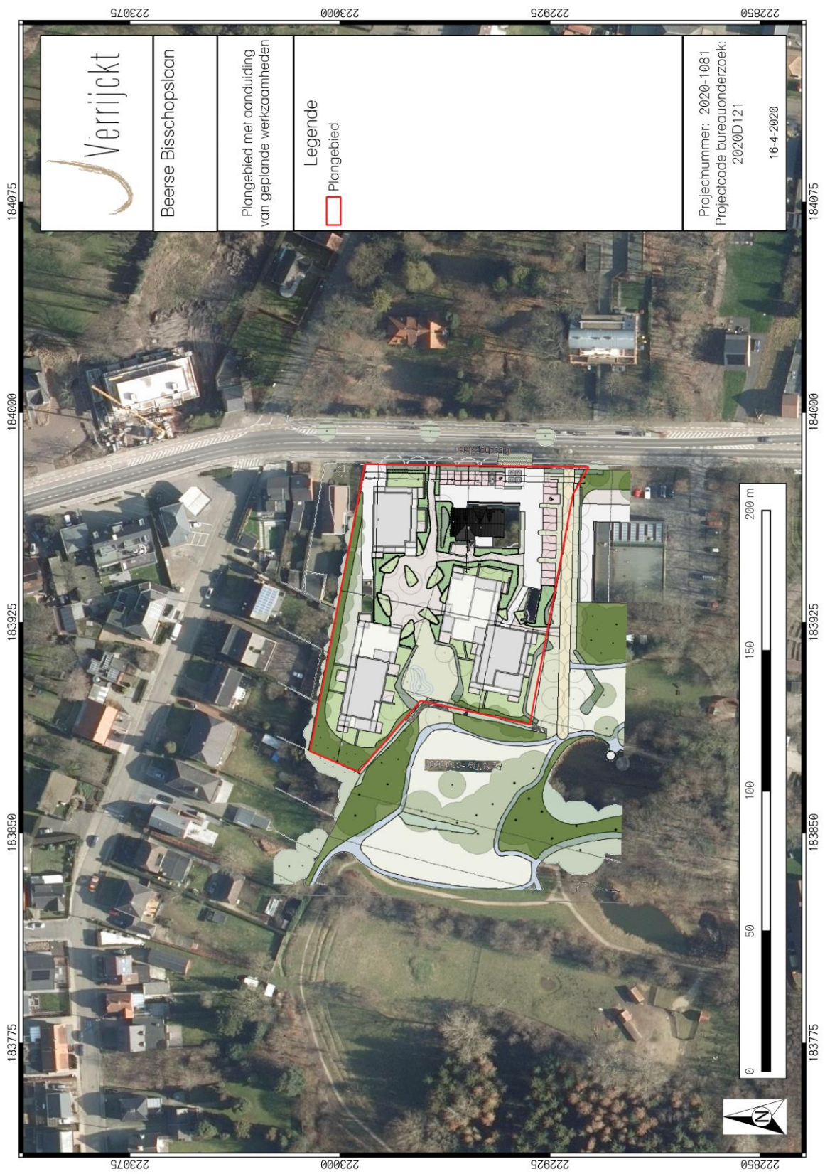
Figuur 1: Plangebied met weergave van toekomstige inplanting 3 op orthofoto 4