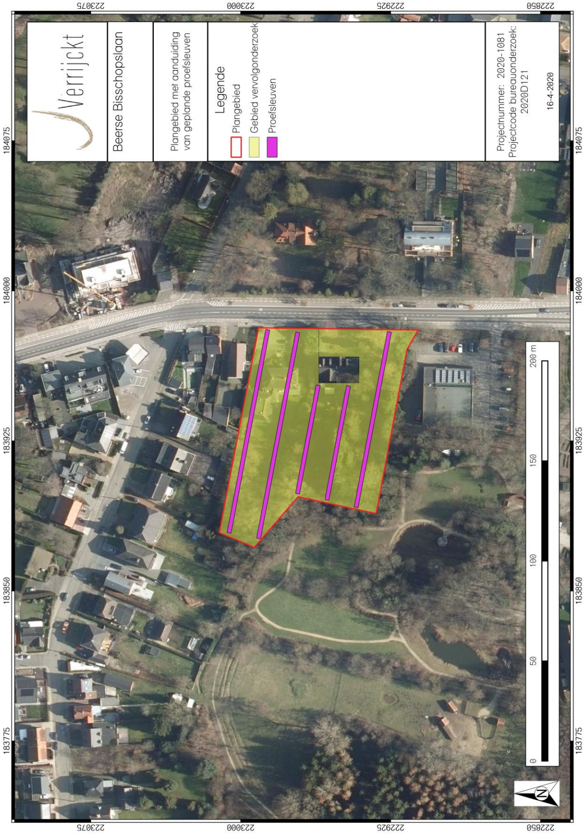
Figuur 5: Sleuvenplan