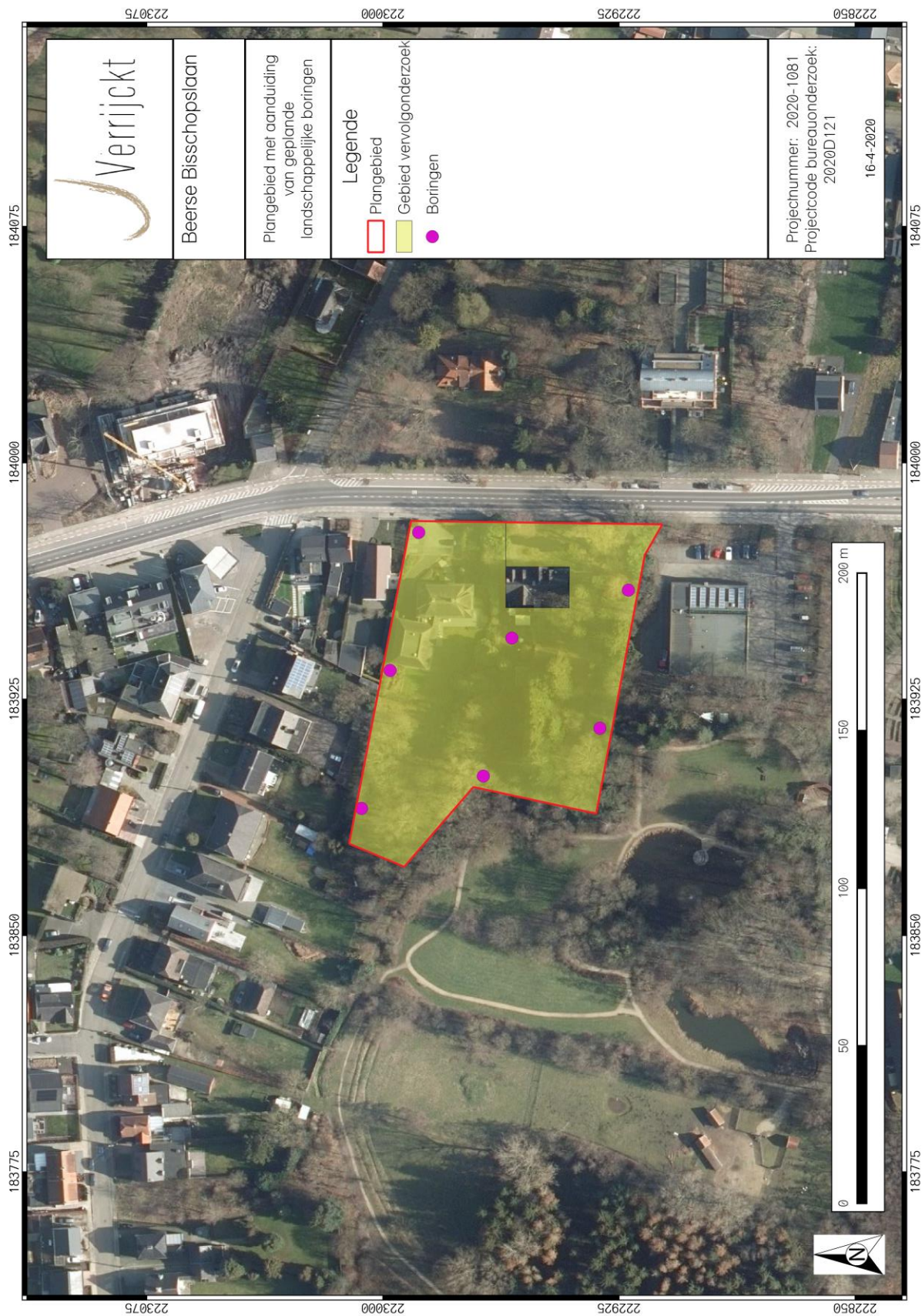
Figuur 4: Inplanting landschappelijke boringen