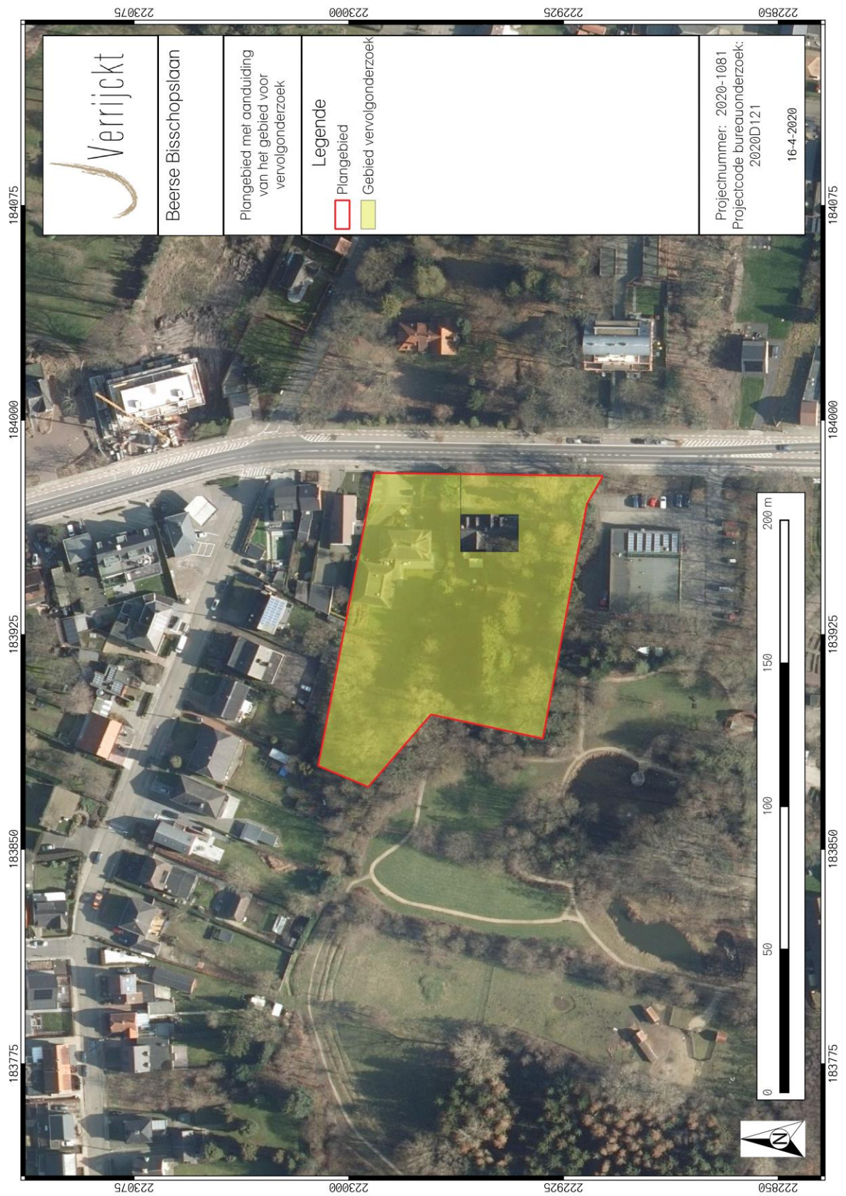
Figuur 3: Plangebied met weergave van gebied voor vervolgonderzoek op orthofoto 6