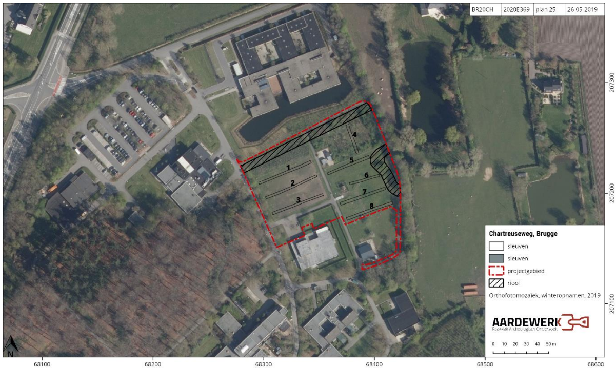
Figuur 2: Het sleuvenplan ten opzichte van de orthofoto uit 2019 (AGIV)