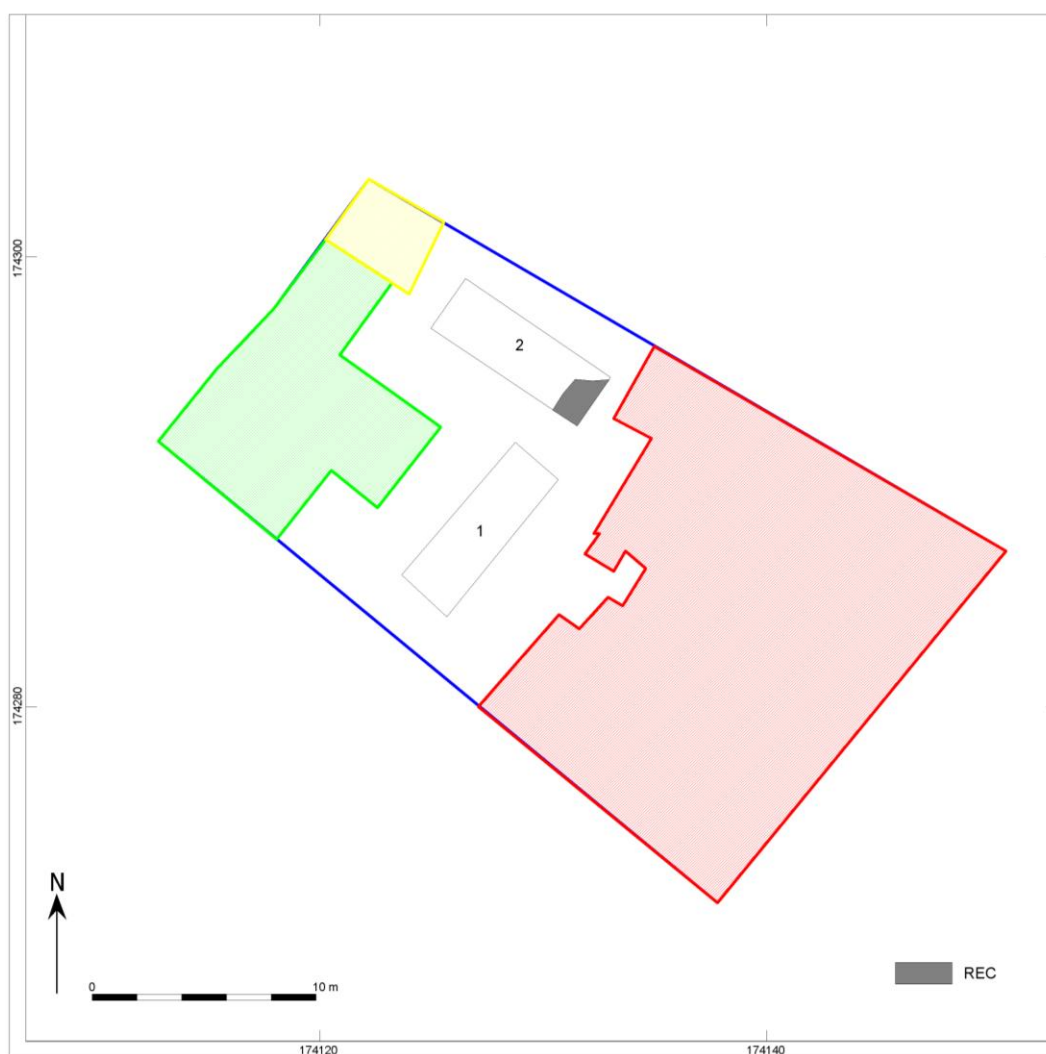
Afb. 2. Allesporenkaart van het proefsleuvenonderzoek.

Vervolgonderzoek biedt door de afwezigheid van archeologische sporen in het plangebied weinig kans op kennisvermeerdering.