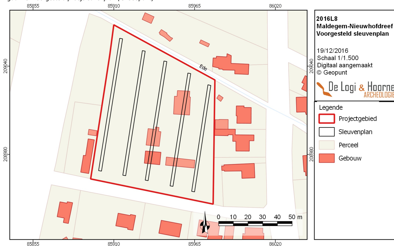
Figuur 43: Voorgesteld proefsleuvenplan

De proefsleuven en kijkvensters dienen afgegraven te worden met een graafmachine voorzien van rupsbanden en een tandeloze, 2m brede graafbak. Om de diepte van het archeologisch vlak te bepalen, wordt de kraan steeds begeleid door minstens één archeoloog en worden alle verdere voorschriften uit de Code van Goede Praktijk gevolgd. Het projectgebied dient, conform de Code van Goede Praktijk, te worden onderzocht door middel van parallelle continue proefsleuven