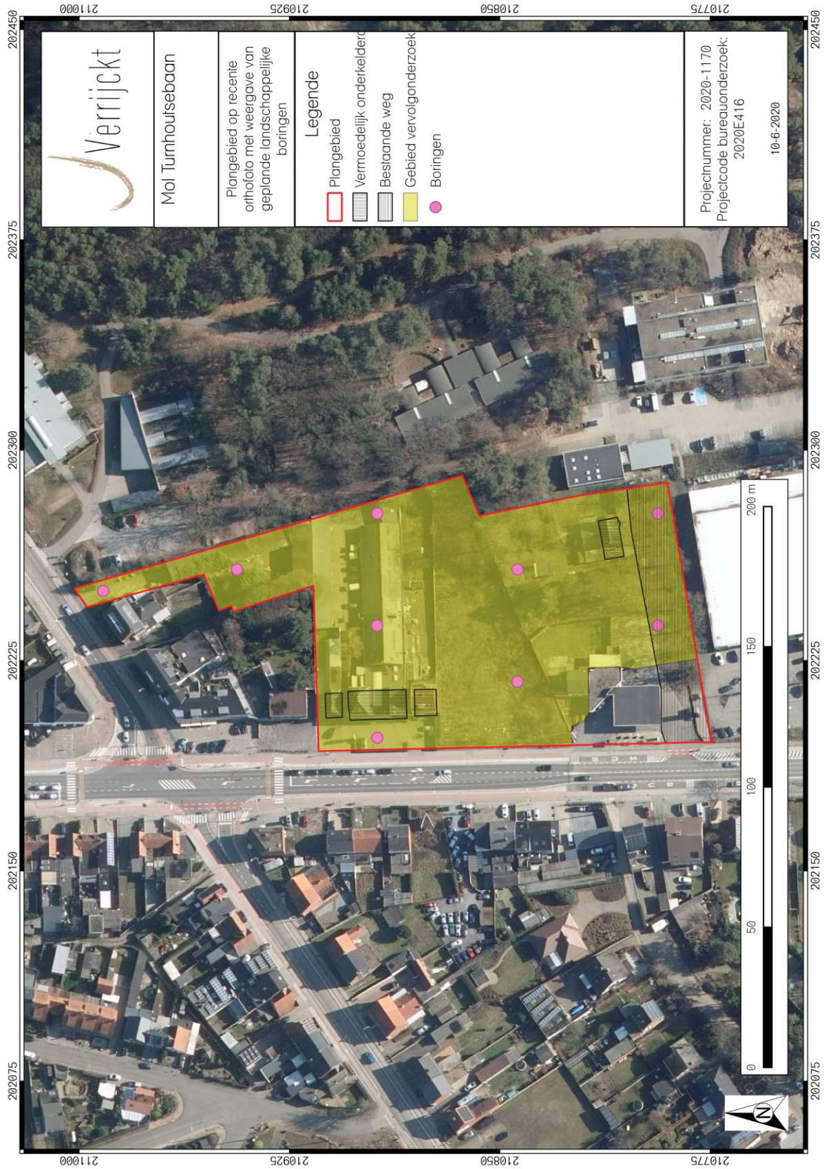
Figuur 3: Inplanting landschappelijke boringen