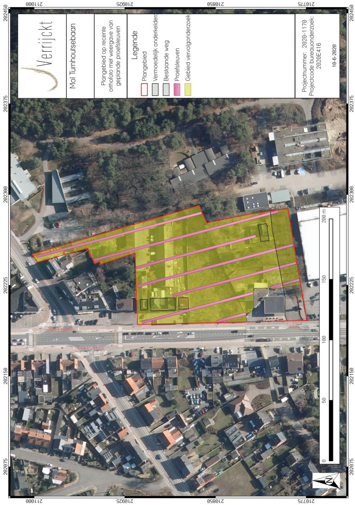
Figuur 4: Sleuvenplan