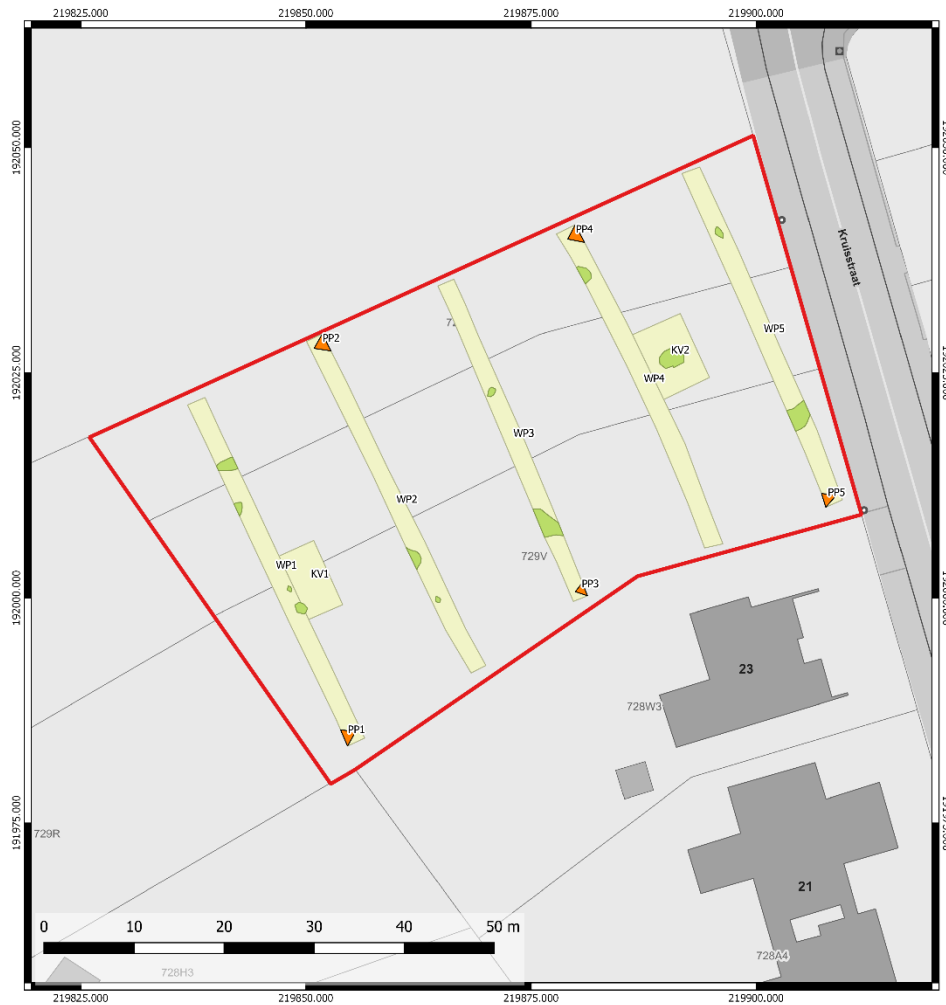
Figuur 2: Allesporenplan (ARCHEBO, bvba, 2020)