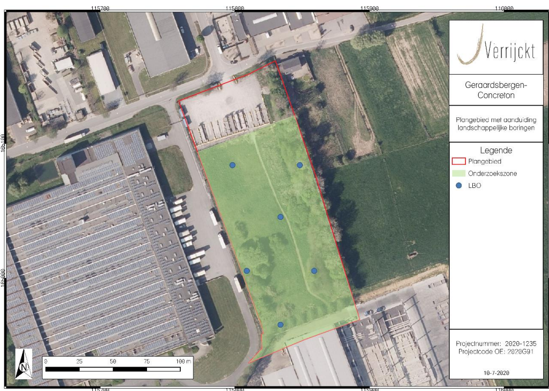
Figuur 2: Inplanting landschappelijke boringen

Binnen het plangebied worden de boringen geplaatst in een verspringend driehoeksgrid van 50 x 40 m. Concreet betekend dit dat er binnen het plangebied 8 boringen geplaatst worden. Mocht ter plaatse blijken dat deze vooropgestelde boorpunten onuitvoerbaar of ontoegankelijk zijn kan de veldwerkleider ter plaatse evalueren en herlokalisieren. Het verplaatste boorpunt wordt in dat geval opnieuw ingemeten en aangeduid op de kaart.