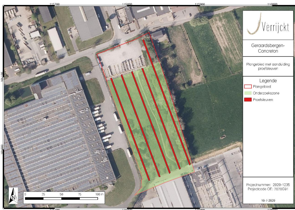
Figuur 3: Sleuvenplan