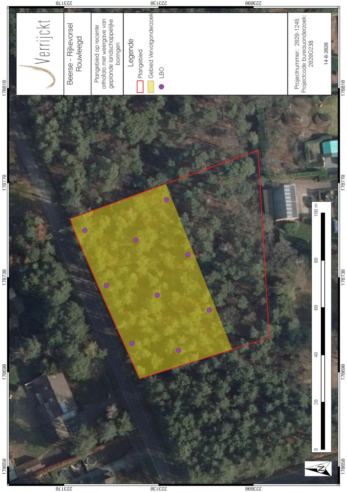
Figuur 2: Inplanting landschappelijke boringen