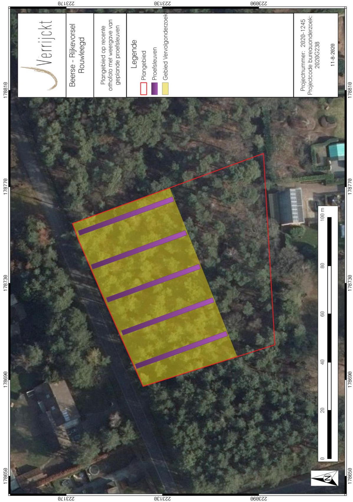
Figuur 3: Sleuvenplan