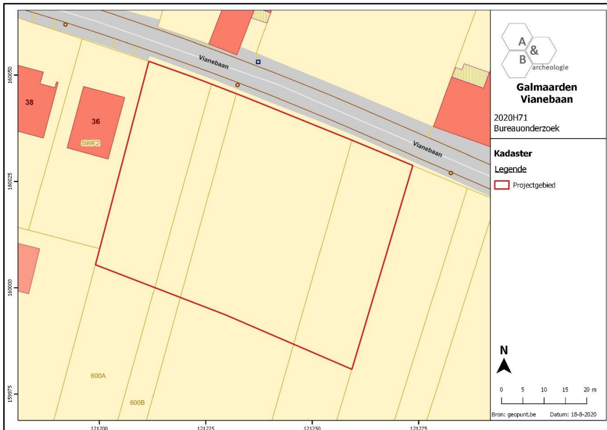
Figuur 1 Aanduiding van het plangebied op het kadasterplan.

Het totale plangebied komt in aanmerking voor verder vooronderzoek.