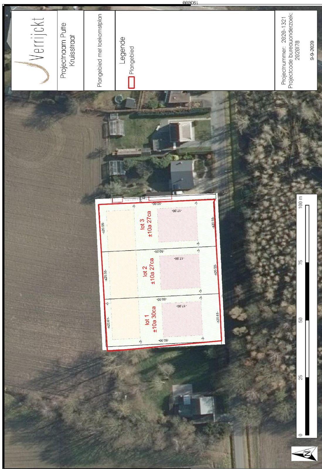
Figuur 1: Plangebied met weergave van toekomstige inplanting 3 op orthofoto 4