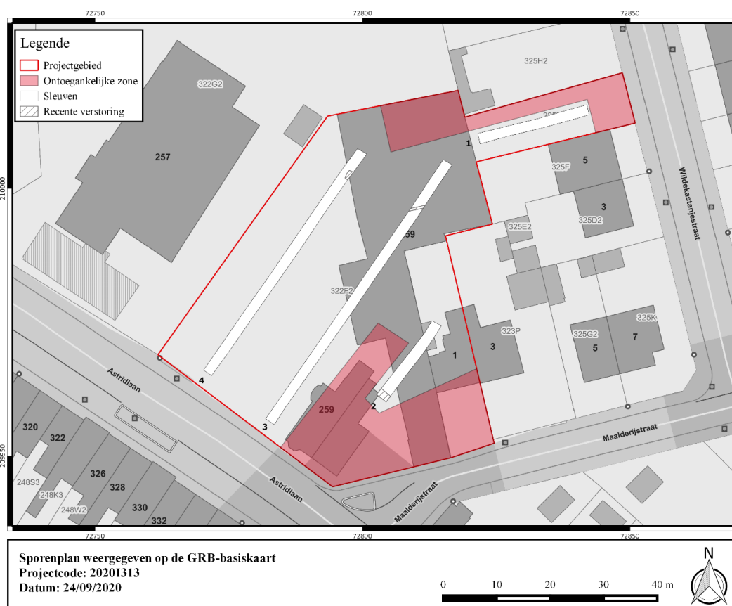
Figuur 2: Thematische kaart

Tijdens de aanleg van de sleuven werden 4 bodemkundige profielen geplaatst. Hieruit blijkt dat de bodem op het projectgebied bestaat uit 2 antropogene ophogingen, welke de originele bodemopbouw van het projectgebied afdekken.