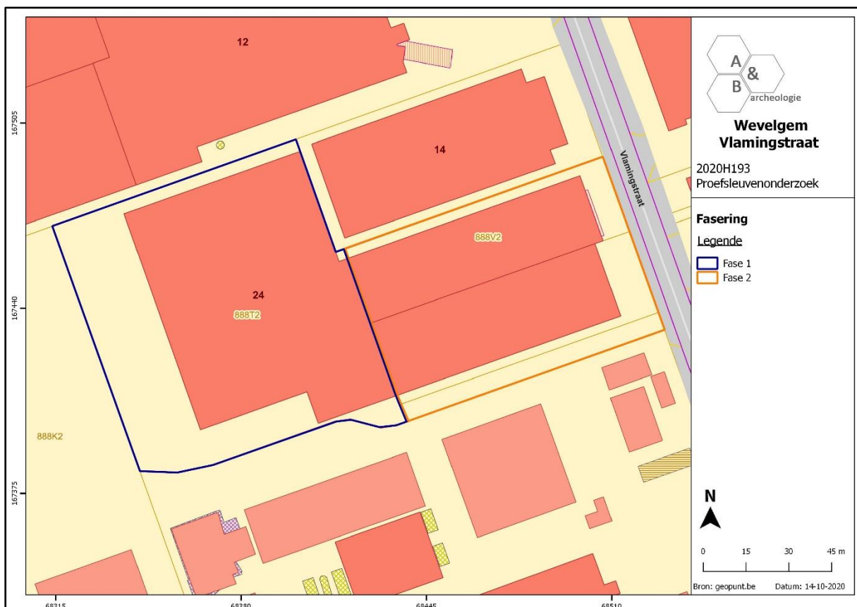
Figuur 1 Aanduiding van de twee zones (fase 1 en fase 2). Fase 1 (blauw) werd afgerond, fase 2 (oranje – ca. 6.230m 2 ) dient nog uitgevoerd te worden.

Er dient aldus geen verder archeologisch onderzoek uitgevoerd te worden in het westelijke deel van het plangebied dat onderzocht werd tijdens de eerste fase van het onderzoek. Binnen het oostelijke deel van het plangebied (fase 2 - ca. 6.230m 2 ) moet wel nog een verder proefsleuvenonderzoek gebeuren. De resultaten van dit onderzoek zullen besproken worden in een afzonderlijke nota. De modaliteiten van dit vooronderzoek werden reeds beschreven in het programma van maatregelen horende bij de bureaustudie.