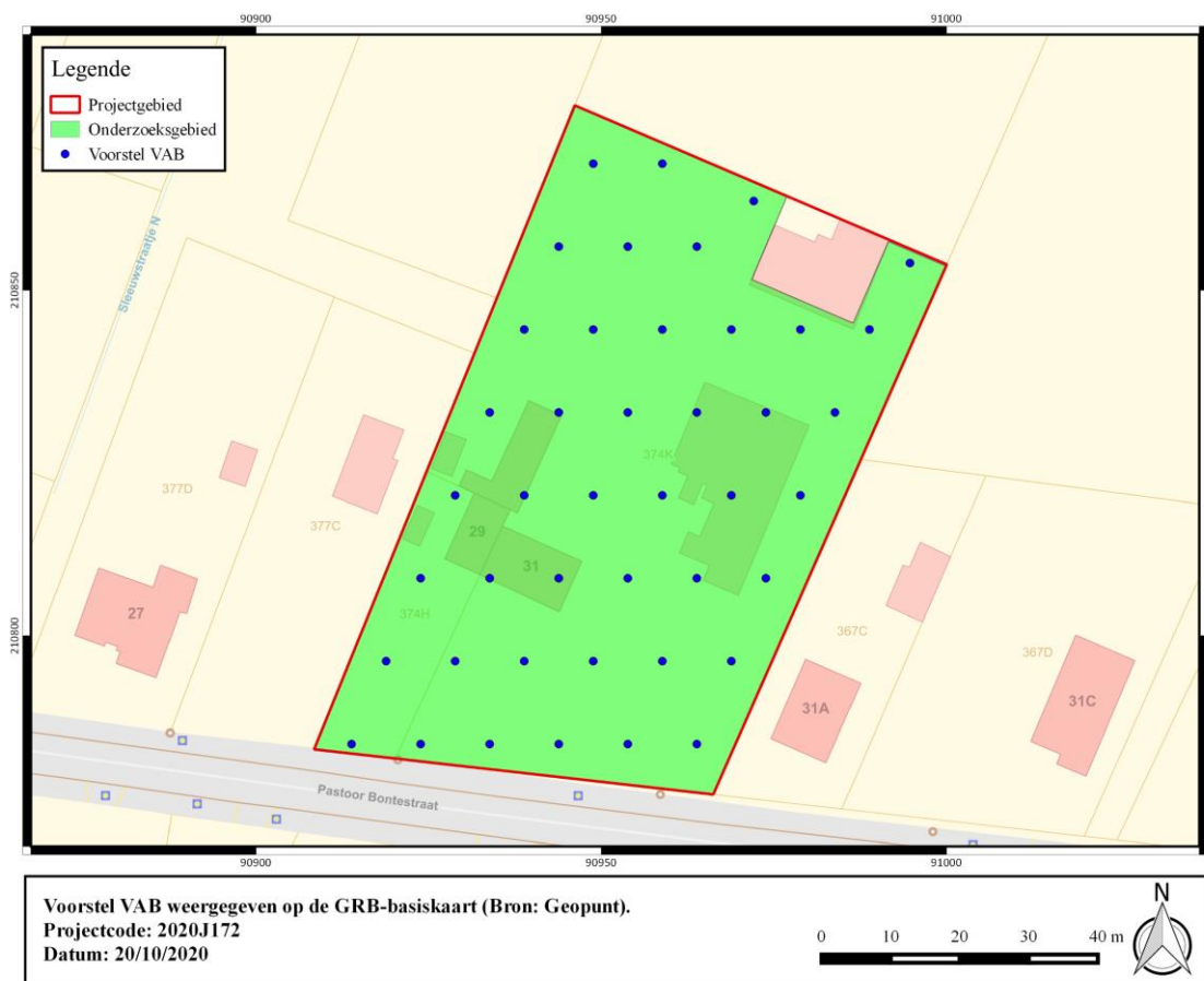
Figuur 3: Voorstel VAB weergegeven op de GRB-basiskaart.

Ook de waarderende boringen worden gezet met een Edelmanboor met diameter van 10cm. Er wordt een grid gehanteerd van maximaal 5m op 6m. Verder is de bemonsteringsstrategie volledig afhankelijk van de resultaten van het verkennend archeologisch booronderzoek.