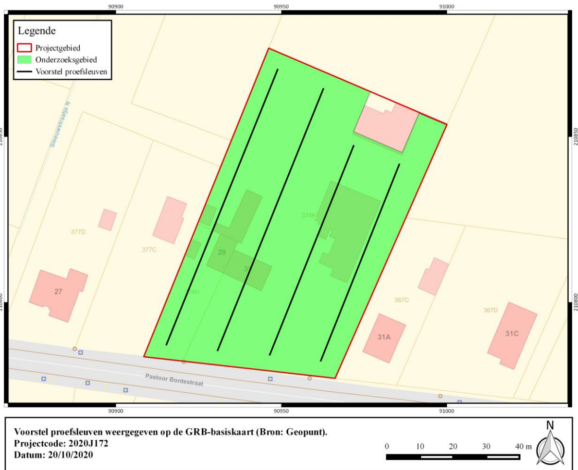
Figuur 4: Voorstel proefsleuven weergegeven op de GRB-basiskaart.

De proefsleuven worden aangelegd door een rupskraan met gladde bak. Deze graafmachine dient over voldoende vermogen te beschikken om een vlotte werking te garanderen. De minimale breedte van de kraanbak bedraagt 2m. De proefsleuven worden laagsgewijs uitgegraven door de kraan, onder begeleiding van de veldwerkleider, tot op het archeologisch leesbaar niveau. Indien sprake is van meerdere sporenniveaus wordt pas gezakt naar het dieperliggende niveau indien het bovenliggende vrij is van sporen.