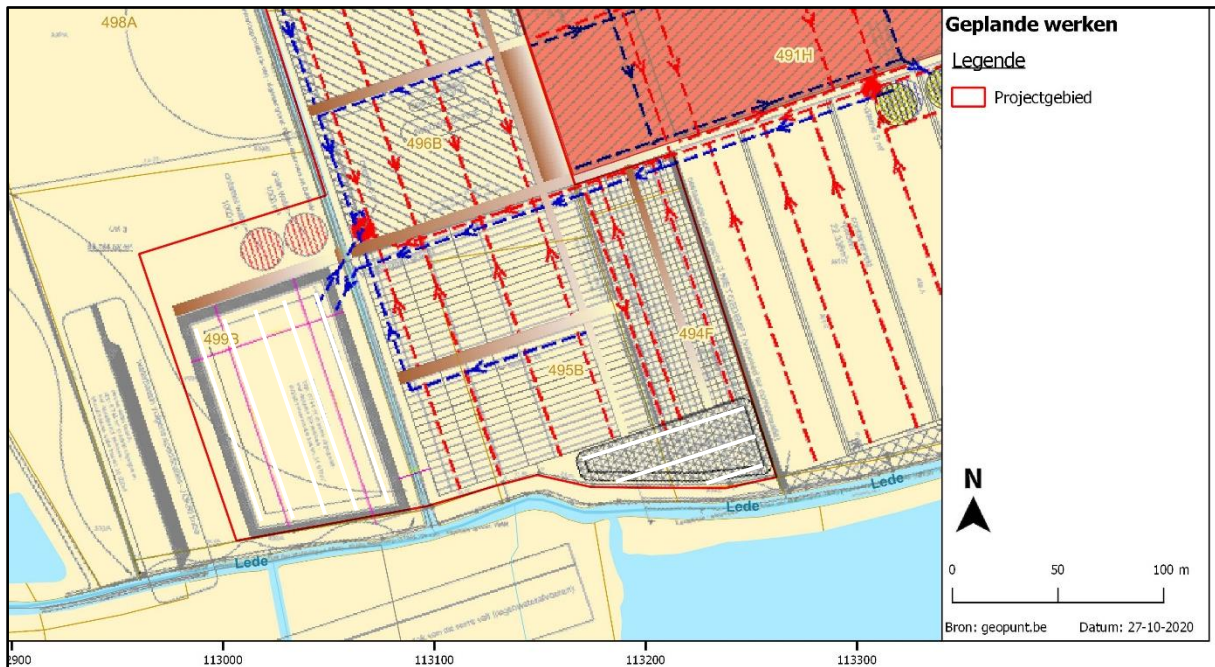
Figuur 2 Indicatief sleuvenplan (witte balken), geprojecteerd op de geplande werken en de kadasterkaart.