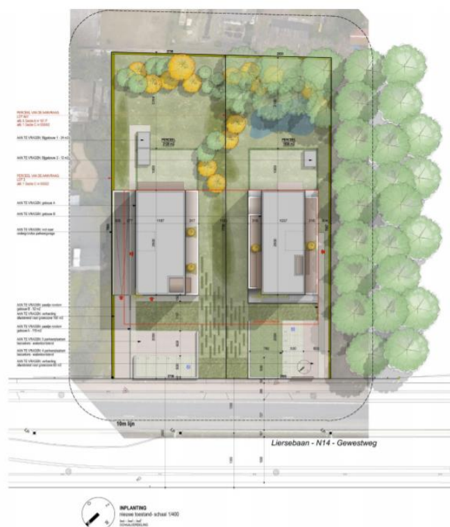
Figuur 1: Overzicht van de toekomstige inplanting. 1

Er worden twee gebouwen opgetrokken binnen het terrein, één op elk perceel. De oppervlaktes van beide gebouwen bedragen 375,73 en 418,09 m 2 . Op beide percelen wordt telkens een bijgebouw voorzien van 24 en 12 m 2 , steeds ten zuidoosten van de hoofdgebouwen. Ze worden gefundeerd op een funderingszool dat wordt uitgegraven tot een diepte van 80 cm-mv. Verder wordt verharding aangelegd met een verstoringsdiepte tot 40 cm-mv, alsook parkeerplaatsen. Een inrit tot ondergrondse parking wordt voorzien ter hoogte van het oostelijke gebouw. De inrit wordt ten noordoosten van het gebouw voorzien. De kelder met parkeergarage heeft een oppervlakte van circa 1550 m 2 en veroorzaakt een verstoring van 3,5 m-mv. Verder worden waterputten, septische putten, infiltratie, nutsleidingen en dergelijke voorzien. Bomen die zich niet in de ontwikkelingszone bevinden blijven behouden. Voor gedetailleerde informatie omtrent deze geplande werken wordt verwezen naar de archeologienota.