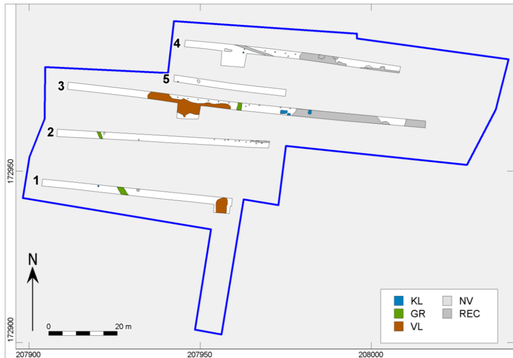
Afb. 3. Overzichtskartaal van de aangetroffen sporen.