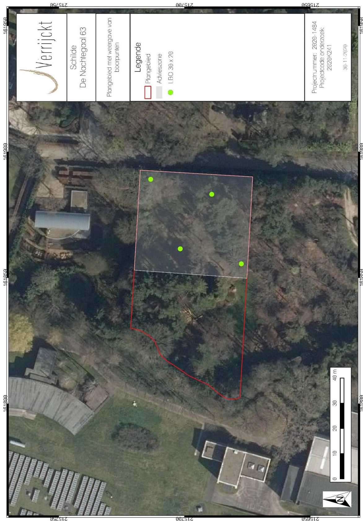
Figuur 2: Inplanting landschappelijke boringen