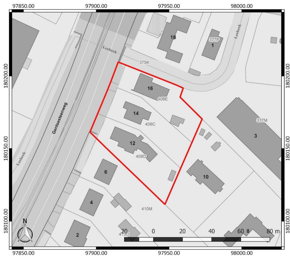
Figuur 1: Kadasterplan met aanduiding van het onderzoeksgebied in rood