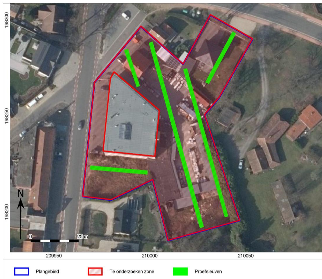
Afb. 5. De proefsleuven gepland op het plangebied

Het onderzoek wordt uitgevoerd conform de bepalingen in de Code van Goede praktijk, specifiek zoals verwoord in hoofdstukken 8 en 12.