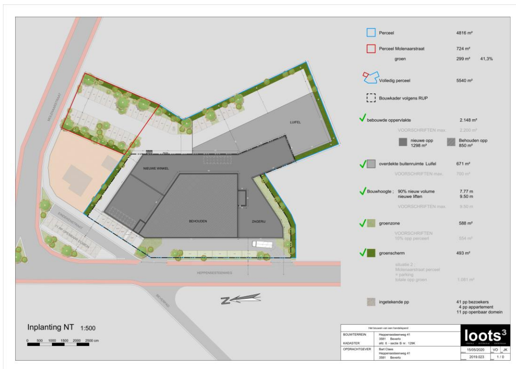
Afb. 3. Technische tekening van de geplande toestand.

Het doel van de geplande werken is om een winkel met magazijn uit te gaan breiden (afb. 3). Om deze werken te verwezenlijken, dienen de woningen in het noorden van het plangebied gesloopt te worden en zal de bestaande verharding opgebroken worden.