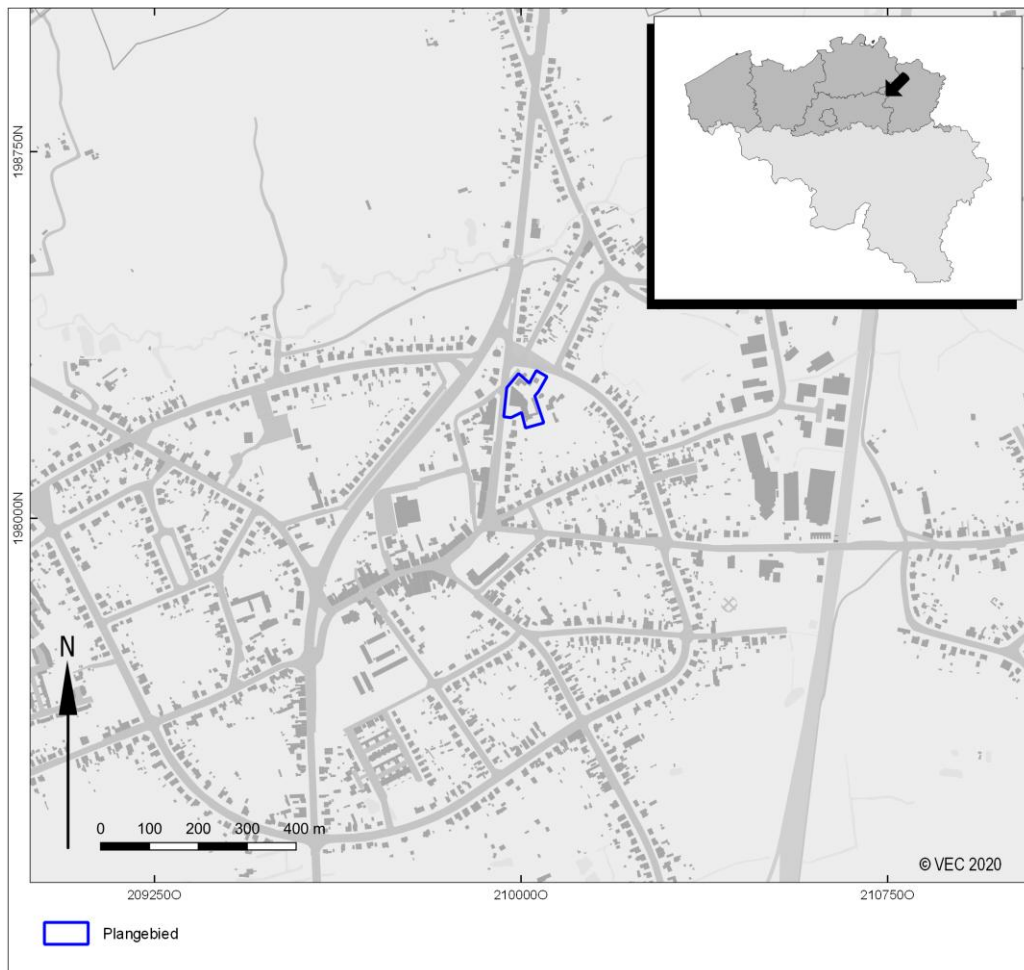
Afb. 1. Het plangebied en omgeving op de Basiskaart Vlaanderen (GRB).

In verband met dit plangebied werd reeds in 2017 een archeologienota opgesteld en bekrachtigd (ID 5588 1 ). De plannen werden echter gewijzigd, waardoor een aanpassing van de archeologienota nodig is.