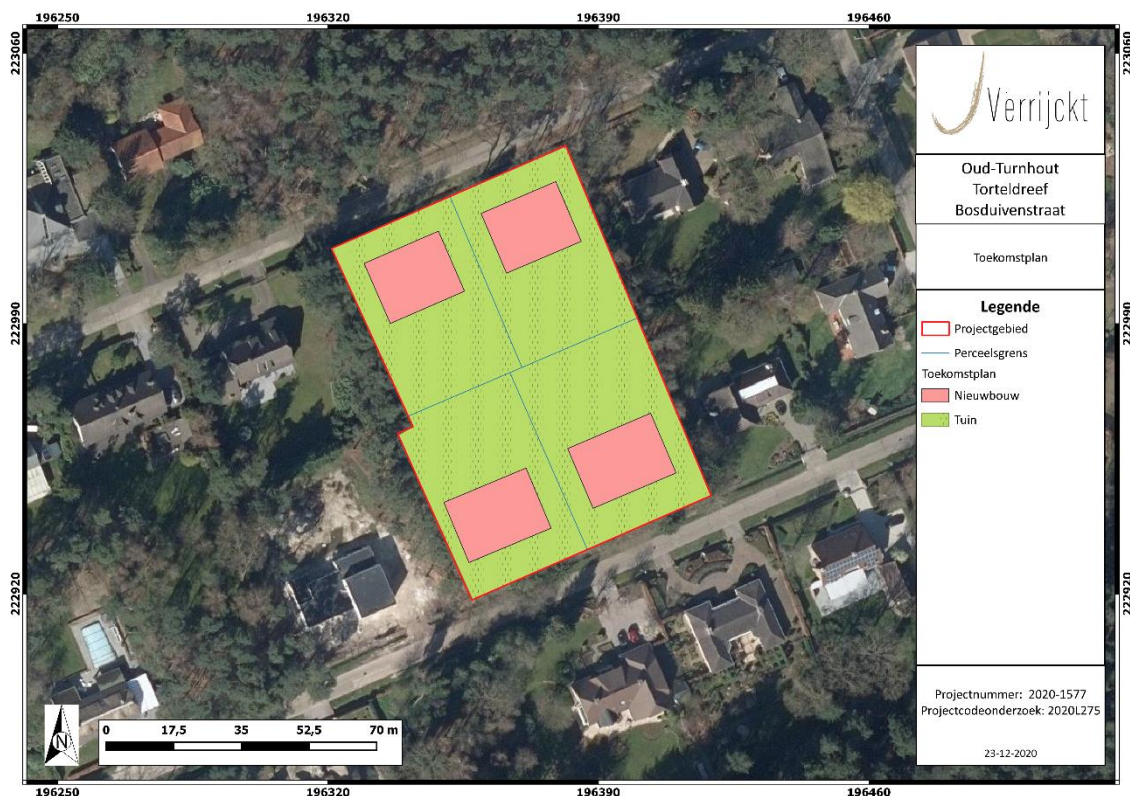
Figuur 1: Plangebied met weergave van toekomstige inplanting 1 op orthofoto 2