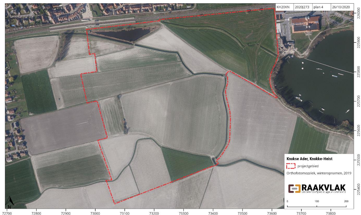
Figuur 1: Het projectgebied op de orthofoto uit 2019 (AGIV)

De Gemeente Knokke-Heist plant de aanleg van een stadsrandbos langs de Knokse Ader in Knokke-Heist. De oppervlakte van de geplande werken bedraagt 28ha. Om de mogelijke aantasting van het bodemarchief op deze terreinen in te schatten werkt de Gemeente Knokke Heist samen met Raakvlak. Doel van de opdracht is het waarderen van het terrein aan de hand van een bureauonderzoek en een landschappelijk bodemonderzoek. Dit onderzoek resulteert in een archeologienota.