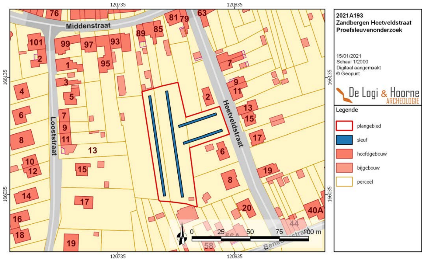
Figuur 31: Voorgesteld proefsleuvenplan

Het voorgestelde proefsleuvenplan omvat 4 proefsleuven. Twee proefsleuven hebben een ONO-WZW oriëntatie, terwijl twee sleuven een NNW-ZZO oriëntatie heeft. De sleuven hebben een totale oppervlakte van 494m 2 .